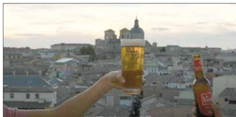
Captura del spot transmitido en la Televisión castellano manchega.