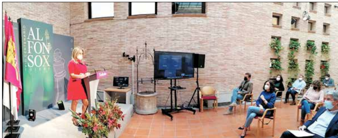
Milagros Tolón durante la presentación de los presupuestos municipales ante su equipo de gobierno.

Las nuevas cuentas municipales, que crecen un 16 por ciento con respecto a 2021, amplían en un 64,51 por ciento la inversión del Área de Desarrollo Económico y