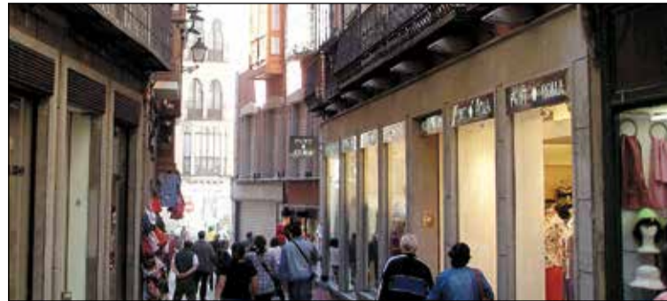
En 2022 se desarrollará un plan de sostenibilidad turística para la ciudad.

En la parte laboral unas 600 personas se han beneficiado de los programas de empleo y formación que ha ayudado a que los datos del paro en Toledo sean mas que positivos en los últimos meses. Desde mayo de 2020 hasta hoy se han creado en Toledo 5000 puestos de trabajo aún a pesar de la crisis, es la ciudad de CLM