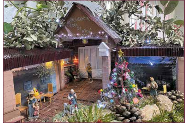
Fragmento del Belén ganador del concurso