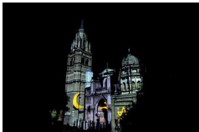
Este año han participado agencias y proyectos de 15 países diferentes.