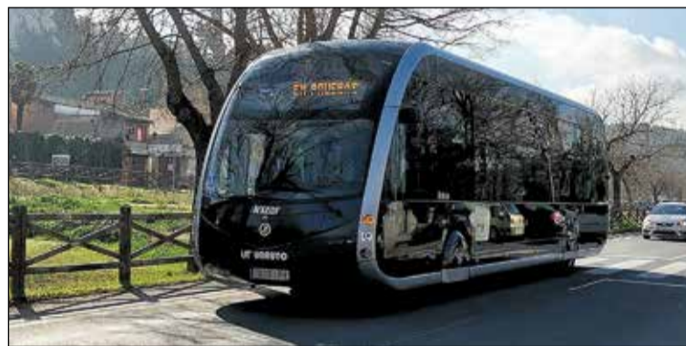
El nuevo autobús ya ha comenzado a hacer pruebas por la ciudad.

Este nuevo modelo de autobús 100% eléctrico ya ha empezado a hacer pruebas por las calles de Toledo y llega procedente de la compañía Irizar. El objetivo del equipo de Gobierno es adquirir