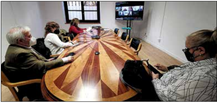
Durante el año 2021 la OMIC ha registrado un total de 4.610 consultas.