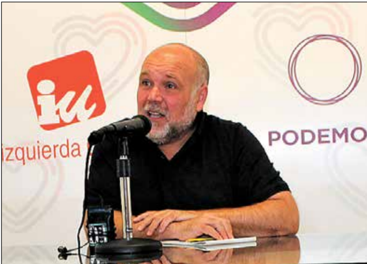
Txema Fernández, portavoz de IU-Podemos.