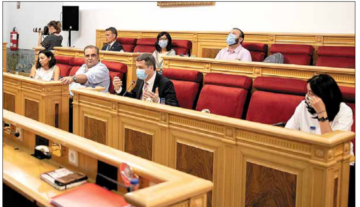
Ambas formaciones defienden que «la actual Ley de seguridad ciudadana es plenamente constitucional»