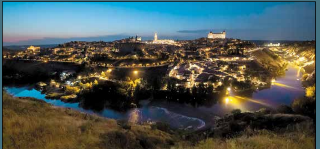
La panorámica nocturna de Toledo ha sido elegida como «la más bonita del mundo».

En este encuentro, el Consejo Local de la Mujer, así como el Centro de la Mujer y la Casa de Acogida también han contado con cierto protagonismo, ya que el manifiesto recogía una firme defensa de estos recursos municipales que «intenta hacerlo lo mejor que se puede y se sabe» a propósito de quienes «ponen en duda su utilidad y que se cierran» en beneficio de una organización religiosa.