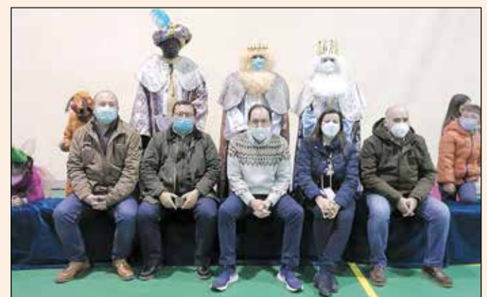
Reyes Magos Argés. Los Reyes Magos llegaron a las 20.00 a un pabellón deportivo abarrotado por vecinos que no quería perderse la visita de Sus Majestades.