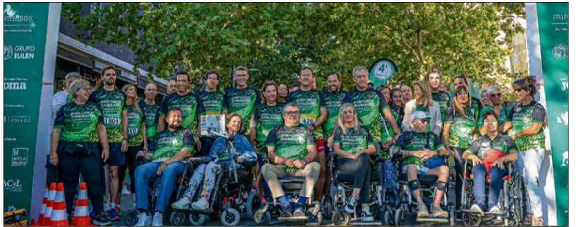
Imagen de la carrera del año 2023.

Las inscripciones para la carrera, tanto en modalidades infantiles como generales, ya están abiertas a través de la web de la Fundación, www.eurocajarural.fun , y se extenderán hasta el 3 de octubre. Este año, la carrera estará