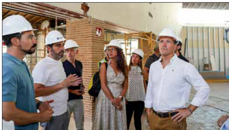
Carlos Velázquez asegura que con esta intervención garantizará la mejora de los servicios de proximidad a los vecinos del Casco Histórico.

ta y la demanda de viviendas en la ciudad. Además, Velázquez expresó su deseo de que «todas las personas que quieran vivir en Toledo tengan la oportunidad de hacerlo». El alcalde citó como ejemplo la recuperación de la Empresa Municipal del Suelo y la Vivienda para el propósito para el que fue creada, que es proporcionar vivienda «principalmente» para jóvenes y familias toledanas. Por lo tanto, recordó que antes de que termine el año, la primera promoción de viviendas en el barrio de Santa Bárbara será una realidad.