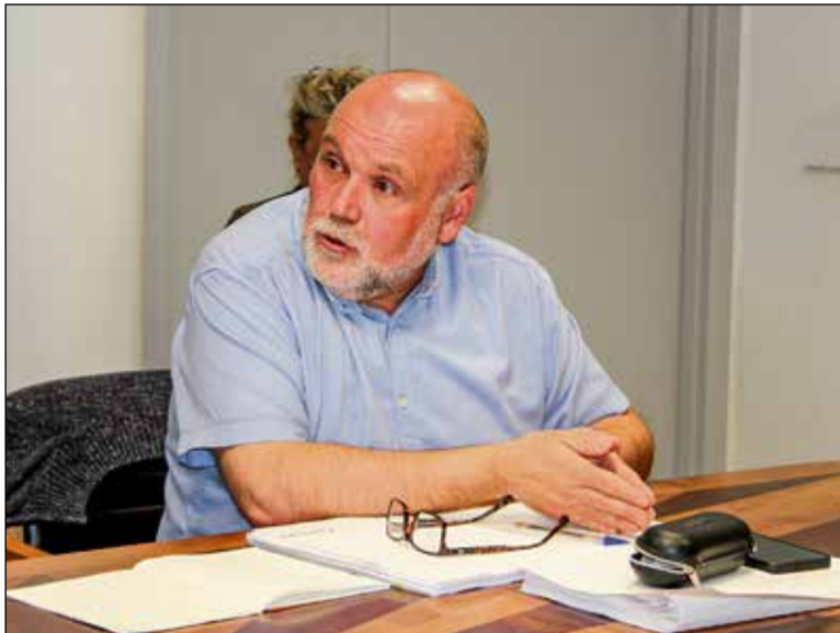
Txema Fernández concejal de IU-Podemos en el Ayuntamiento de Toledo.