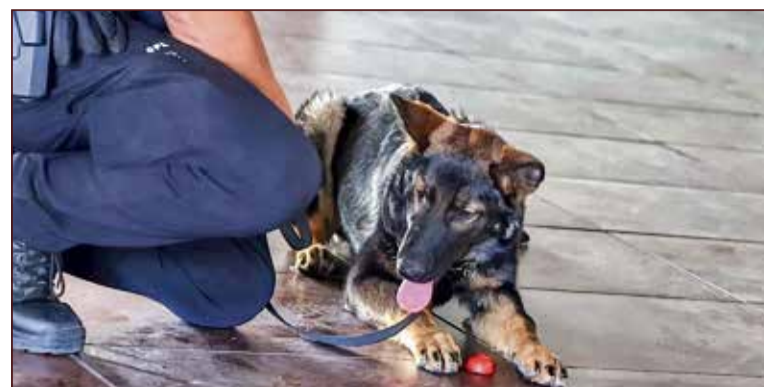
Los guías caninos son excelentes profesionales.

El plan parcial deberá contemplar una ordenación y planificación integral del sector, garantizando una adecuada integración urbanística, con propuestas arquitectónicas de calidad, zonas verdes y equipamientos colectivos. Además, se prestará especial atención a la sostenibilidad, con un sistema de drenaje sostenible y un estudio hidrológico-hidráulico que avale la actuación.