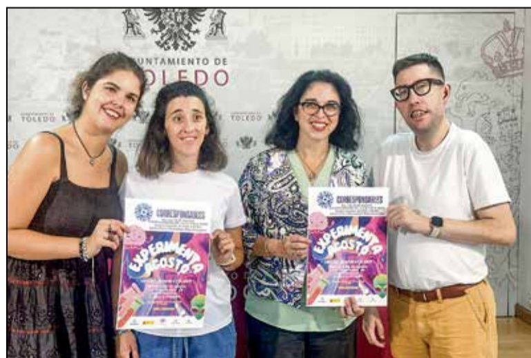
Cuenta con la colaboración de la ONCE que impartirá talleres inclusivos, y con 'El mundo en tus manos', una asociación sin ánimo de lucro que lucha contra la exclusión social, buscando la integración de las personas.

Con este proyecto, se anima a todos los ciudadanos de la ciudad a aumentar su actividad física y disfrutar de los beneficios de una práctica adecuada de ejercicio.