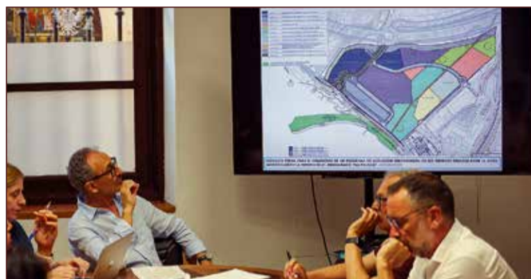
Delgado destacó la importancia de este proyecto para el futuro de Toledo.

Los promotores del proyecto prevén la construcción de alrededor de 575 viviendas en el área, con una reserva de hasta el 40% destinada a vivienda pública, en cumplimiento de la normativa estatal. Esta iniciativa busca no solo impulsar el desarrollo