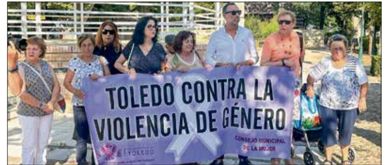
Illescas en la reunión del Consejo Municipal de Políticas de Discapacidad.

La concejala destacó el compromiso del Ayuntamiento de Toledo en la lucha contra la violencia machista desde su llegada al gobierno, resaltando las políticas de sensibilización y actividades orga-