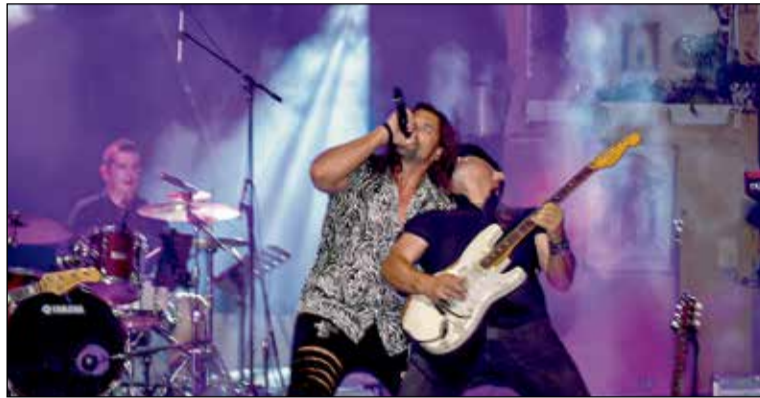
La Edad de Oro del Pop Español será una de las bandas que actuará en la Feria y fiestas de 2024 en la Peraleda.

El programa de la Feria y Fiestas de agosto incluye la incorporación de carpas de ocio en La Peraleda, que ya tuvieron éxito en el Corpus Christi. Las actividades comenzarán el 9 de agosto con la apertura de las carpas y la feria infantil en La Peraleda. El sábado 10 se celebrará el Trofeo Flandiers ciclista, y el lunes 12 será el Día del Niño en el recinto ferial.