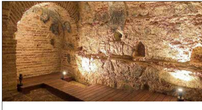
Los baños del Cenizal son uno de los tesoros que pueden mostrarse.

mación del próximo año será especial, ya que se conmemorará el 40 aniversario de las fiestas de la Cornisa.