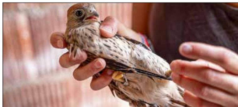
El Programa Convive de Iberdrola tiene como objetivo, integrar las energías renovables con la conservación de la biodiversidad.

El proyecto, puesto en marcha hace año y medio, ha consistido en la construcción de un primillar en la planta fotovoltaica y la cría en cautividad de cernícalos primillas en el CERI. Gracias a estas acciones, se ha logrado establecer una nueva colonia de esta especie, que había desaparecido de la zona hace décadas.