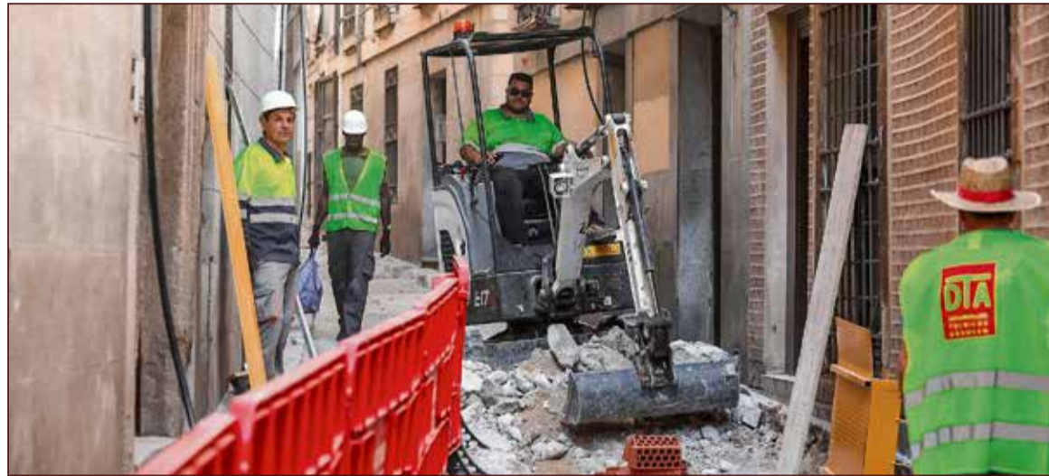
Se trata de una primera fase de una intervención que contempla la mejora del entorno urbano.

La primera fase de las obras, centrada en el tramo de la calle Alfileritos entre la plaza de Santa Clara y la calle Cristo de la Luz, comenzó el 10 de julio y se prevé que dure tres meses. Para facilitar el acceso de residentes y comerciantes a sus viviendas y