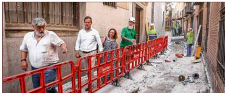
Debido a la estrechez en algunas zonas de la obra, se ha restringido también el tránsito peatonal por el tramo de calle Alfileritos.

negocios, la Policía Local ha implementado un dispositivo especial de tráfico