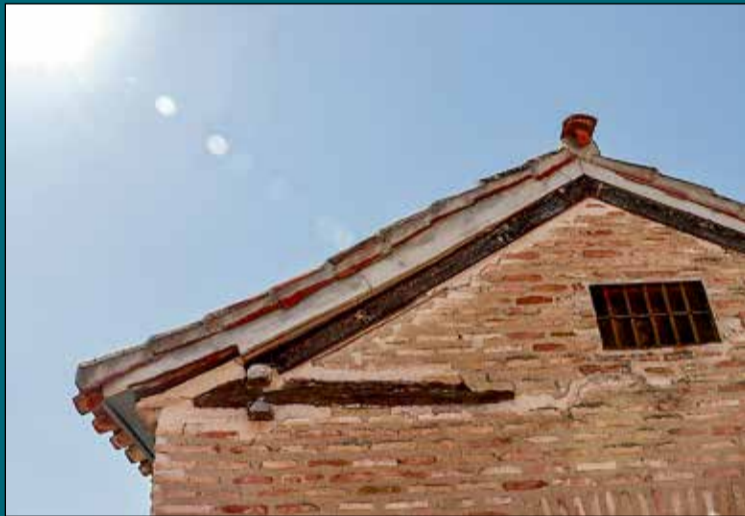
Aprobada la tramitación urgente para la ejecución de obras de rehabilitación en la Casa de las Cadenas. Como consecuencia del deslizamiento del tejado de este inmueble declarado Bien de Interés Cultural hacia la vía pública, La Junta de Gobierno Local ha aprobado hoy en una sesión extraordinaria la tramitación urgente para la ejecución de las obras de rehabilitación en la Casa de las Cadenas. El coste estimado de la actuación es de 100.000 euros.

Por último, en cuanto al área de gobierno de Servicios Sociales, Educación y Familia se amplía la primera prórroga del contrato de servicio de podología en los centros de mayores de Santa María de Benquerencia y el centro de día 'Ángel Rosa' en el barrio de Santa Bárbara, por un importe de 20.000 euros cada una y una duración de un año.