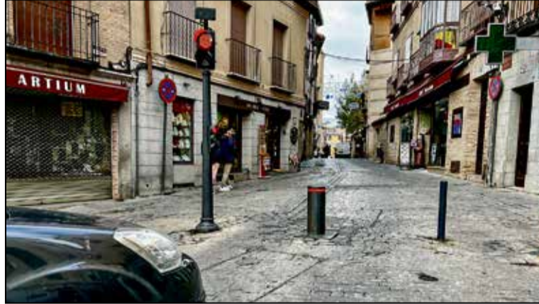
La zona de bajas emisiones ya existía en la ciudad y desde este equipo de Gobierno se está revisando para reforzarla.

Por otro lado, en el área de gobierno de Seguridad, Transportes e Interior, se determinan los días festivos de carácter local para el año 2025, quedando fijados el 23 de enero, festividad de San Ildefonso y el 21 de abril, lunes de Pascua.