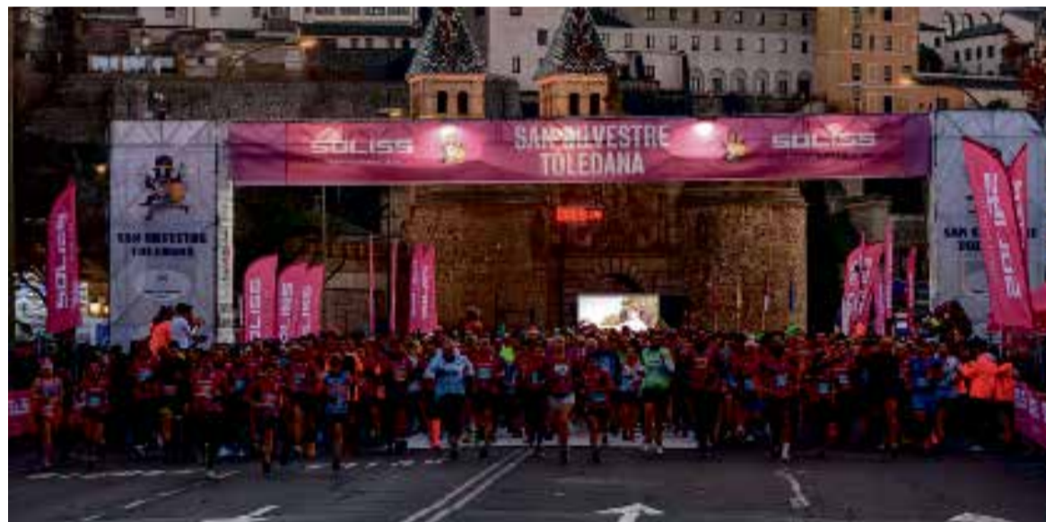
Más de 5.000 deportistas quisieron participar en la tradicional San Silvestre Toledana.

La exposición cuenta con objetos de gran valor histórico y deportivo, como una raqueta de Rafa Nadal, una camiseta y las botas de Fernando Alonso, el maillot del Tour del equipo Banesto de Miguel Induráin, una camiseta de Usain Bolt, las botas de Pau Gasol o el balón del mundial de Sudáfrica firmado por Andrés Iniesta. Cada objeto se acompaña de un panel explicativo y de audioguías accesibles a través de un código QR con narraciones de grandes periodistas deportivos.