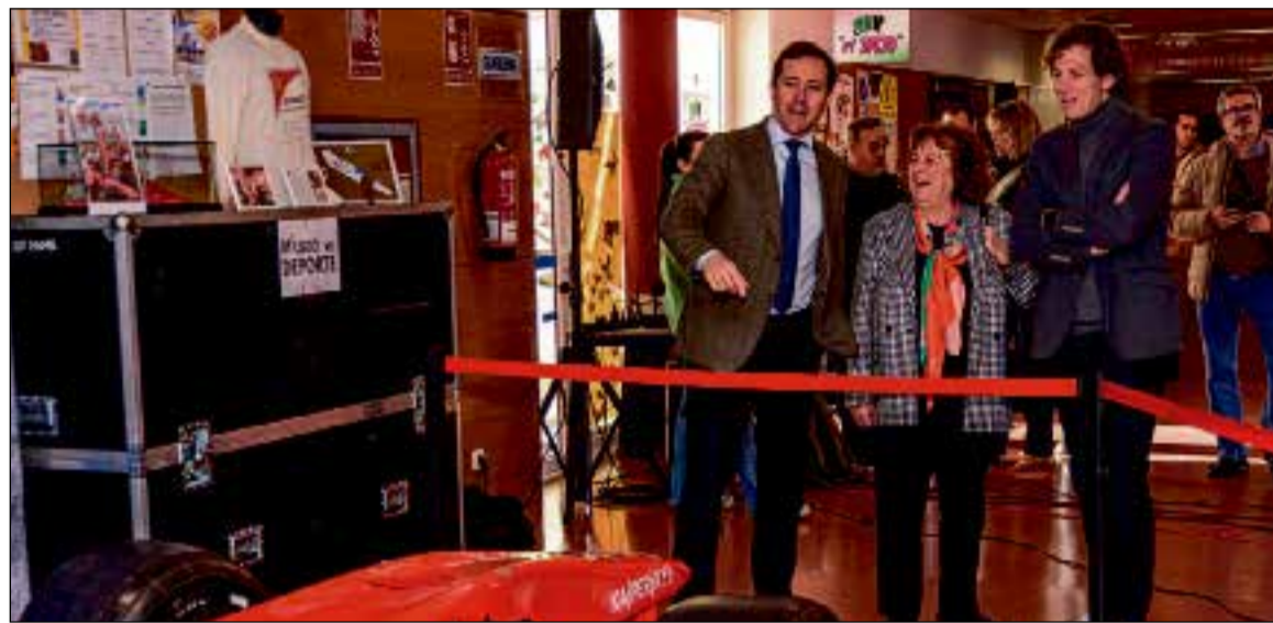
La muestra recopila cerca de 200 piezas de diversas disciplinas que narran las grandes gestas del deporte.