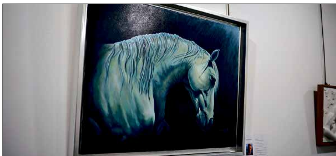
Más de treinta artistas muestran sus obras en esta colección que se exhibe en la sala «Matías Moreno».

La exposición «Free Art XI» es una iniciativa de la Asociación de Amigos de la Escuela de Arte