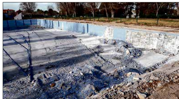
La obra, que ejecuta la empresa STAFF Infraestructuras SLU, Grupo Inporman, supone una inversión de 324.709,55 euros.

Pero la San Silvestre Toledana es mucho más que una carrera. El ambiente festivo y la diversidad de participantes la convierten en un evento único. Numerosos corredores se animaron a participar disfrazados, llenando de color y humor el recorrido. Superhéroes, personajes navideños e incluso algunos corredores solidarios con los afectados por la DANA de finales de octubre se sumaron a la fiesta.