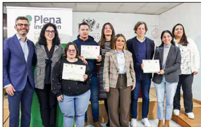
Arranca la última fase de las obras de mejora en Alfileritos-Sillería