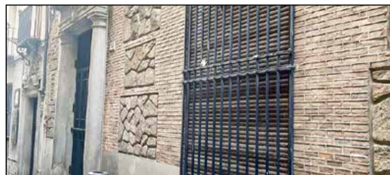
Se somete a información pública que el edificio de Telefónica, en el Casco, pase a uso residencial.