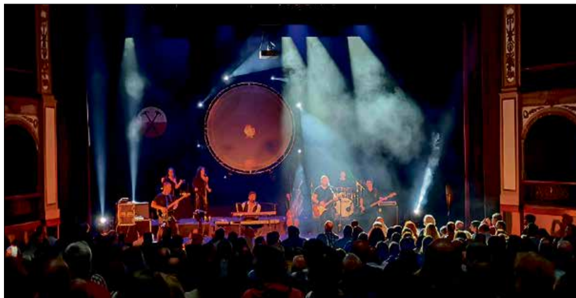
‘The Other Side: A Pink Floyd Live Experience’, considerada por la crítica como el mejor tributo a Pink Floyd.

El segundo espectáculo del que se pueden adquirir las entradas es ‘Todos los ángeles alzaron el vuelo’, estreno nacional de la compañía La Zaranda en el Teatro de Rojas en el mes de marzo, con texto de Eusebio Calonge y