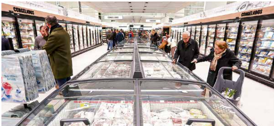
Ubicado en el Parque Comercial Fusión (Av. Del Río Guadiana, S/N, 45007, Toledo) se convertirá en el sexto hipermercado de la enseña valenciana en la región.