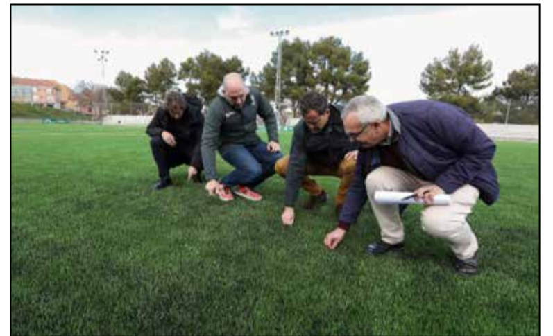
La inversión en el campo ha tenido un coste cercano a los 150.000 euros.

Por último, la concejal de Cultura, ha animado a todos los toledanos a disfrutar de esta divertida y original obra, que «tenemos la suerte de estrenar en la ciudad».