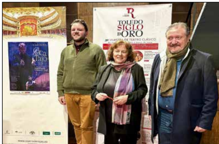
La concejal de Cultura, ha destacado la labor de investigación histórica sobre el teatro clásico realizada por la compañía conquense,

La concejal de Cultura, ha destacado la labor de investigación histórica sobre el teatro clásico realizada por la compañía conquense, gracias a la cual transformamos las tres églogas de Garcilaso