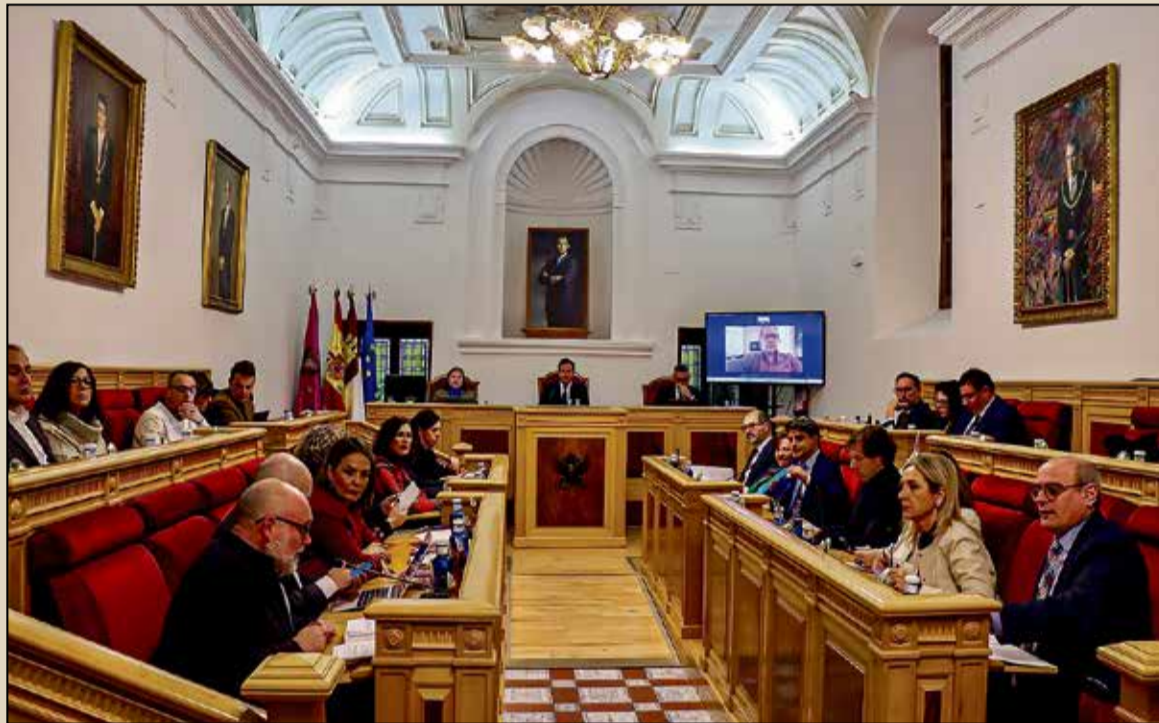
El pleno aprobó los presupuestos para 2025.

Alcalde ha defendido que el presupuesto «da respuesta a las necesidades de los ciudadanos» a través de proyectos concretos como la renovación de instalaciones deportivas, la puesta en marcha del nuevo Plan de Ordenación Municipal, la construcción de viviendas asequibles para jóvenes, la recuperación del río Tajo y la mejora de