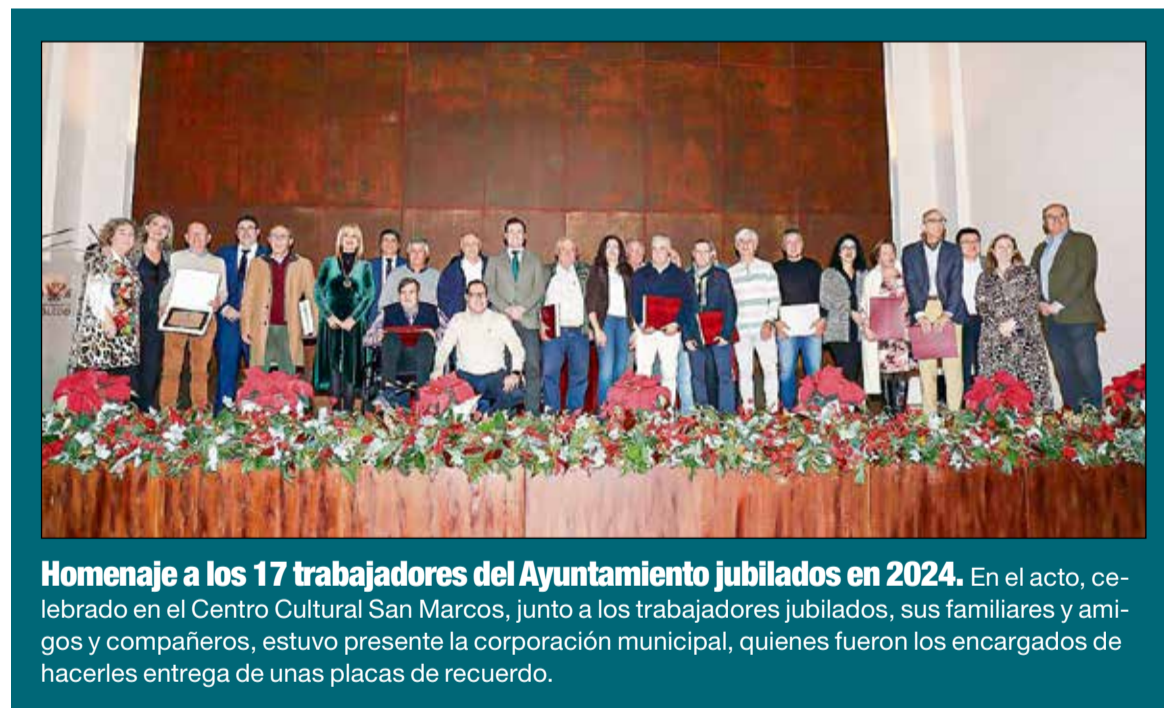
Homenaje a los 17 trabajadores del Ayuntamiento jubilados en 2024. En el acto, celebrado en el Centro Cultural San Marcos, junto a los trabajadores jubilados, sus familiares y amigos y compañeros, estuvo presente la corporación municipal, quienes fueron los encargados de hacerles entrega de unas placas de recuerdo.

La parcela, que también tiene acceso por las calles Río Guadarrama y Río Nogueras, cuenta con edificaciones industriales que actualmente se están demoliendo y dispone de todos los servicios urbanos. El proyecto contempla una edificabilidad de 8.000 metros cuadrados para uso comercial.