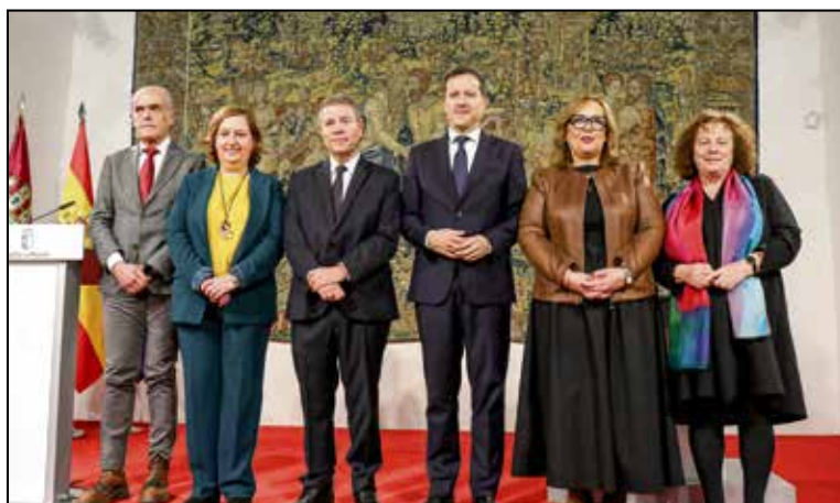
Junta y Universidad se han unido a Toledo en su candidatura como Capital Europea de la Cultura en 2031, en un paso adelante para el proyecto.