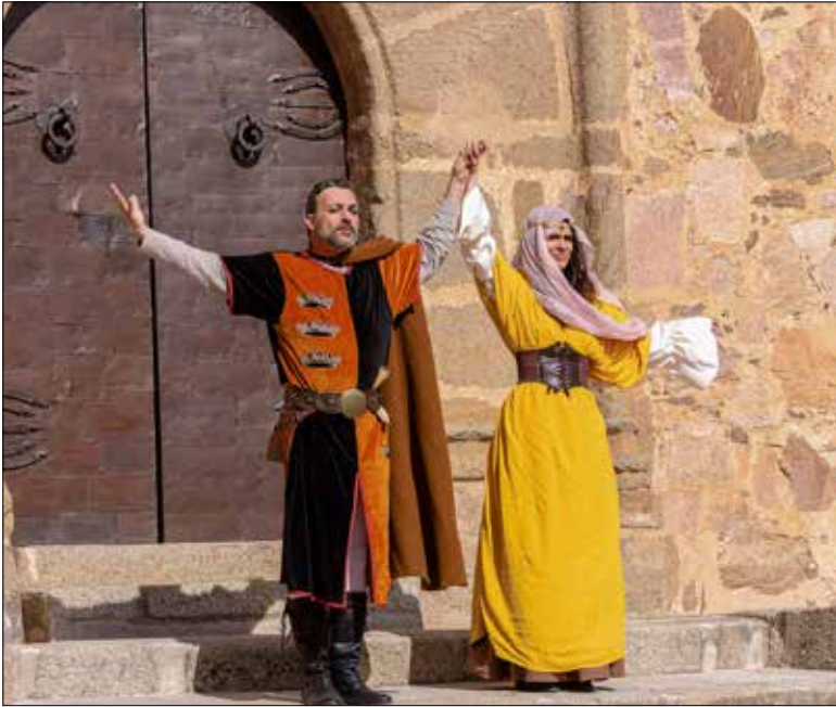
Zaida y Alfonso VI, el amor prohibido entre una princesa musulmana y el conquistador de Toledo, una leyenda representada magníficamente por actores de la compañía de Teatro Atenea de Mora.

Dentro de sus muros, cada castillo esconde una historia muy particular, que será desvelada en las visitas programadas por los guías encargados de transmitir las a los visitantes, para conocerlos mejor, pero también para acercar a los participantes a las leyendas que guardan sus muros