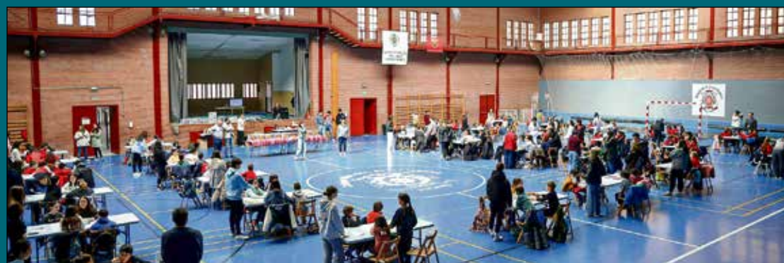
Éxito del II Campeonato de Puzles. En este torneo se dan cita alumnos de los colegios de Educación Especial Ciudad de Toledo, San Juan de Dios (Apace), Infantes, Fábrica de Armas, Valparaíso, La Candelaria, Gómez Manrique, Alfonso VI y Maristas; casi 200 escolares toledanos, que durante unas horas se han alejado del mundo digital, para compartir con sus compañeros una actividad creativa que potencia sus habilidades personales y valores.

La adhesión de la Junta de Comunidades y la UCLM representan un impulso significativo para la candidatura de Toledo, consolidando la apuesta por la cultura y el conocimiento como pilares fundamentales de su propuesta para convertirse en Capital Europea de la Cultura en 2031.