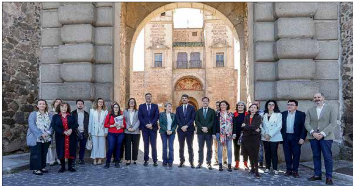
El alcalde ha recordado que en la ciudad hay más de 100 Bienes de Interés Cultural declarados.

Velázquez recordó que Toledo cuenta con más de 100 Bienes de Interés Cultural declarados, entre los que se incluyen las murallas. Si bien la responsabilidad prin-