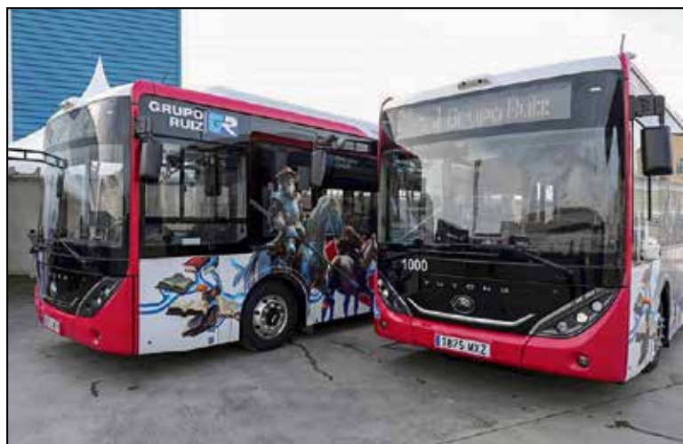
Los billetes se podrán adquirir previamente en la web de UNAUTO y utilizarse hasta 48 horas después de la compra.

a este nuevo sistema y resolver cualquier duda que pueda surgir entre los usuarios, el concejal de Movilidad ha anunciado que durante el mes de abril se ofrecerá formación específica para aquellos que utilizan la aplicación móvil del Grupo Ruiz. Estas sesiones formativas permitirán a los usuarios familiarizarse con el funcionamiento del pago mediante código QR y aprovechar al máximo las funcionalidades de la aplicación.