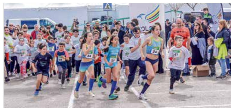
Además, se ha llegado a un acuerdo definitivo con todos los clubes de natación de la ciudad para el uso de las piscinas cubiertas de la ciudad.

La jornada no se limitó a las carreras, sino que ofreció un amplio programa de actividades para toda la familia. Uno de los mayores atractivos fueron las carpas interactivas instaladas por la Policía Local, la Policía Nacional, los Bomberos y otros servicios de emergencias. En estas carpas, los más pequeños disfrutaron enormemente viendo de cerca cómo