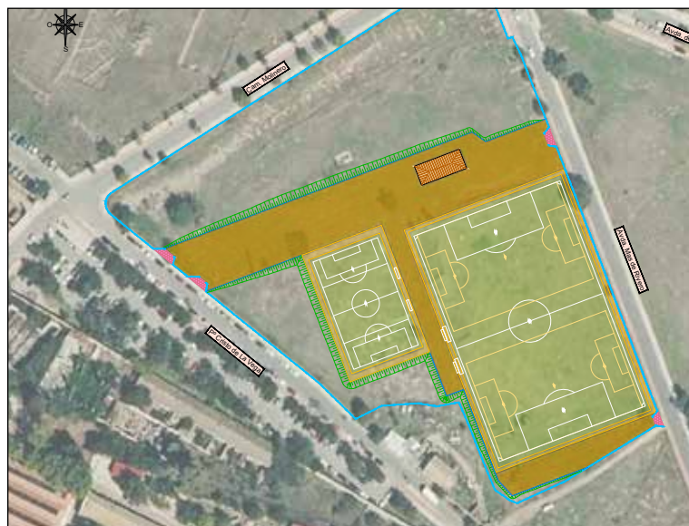
Anteproyecto del nuevo complejo Carlos III