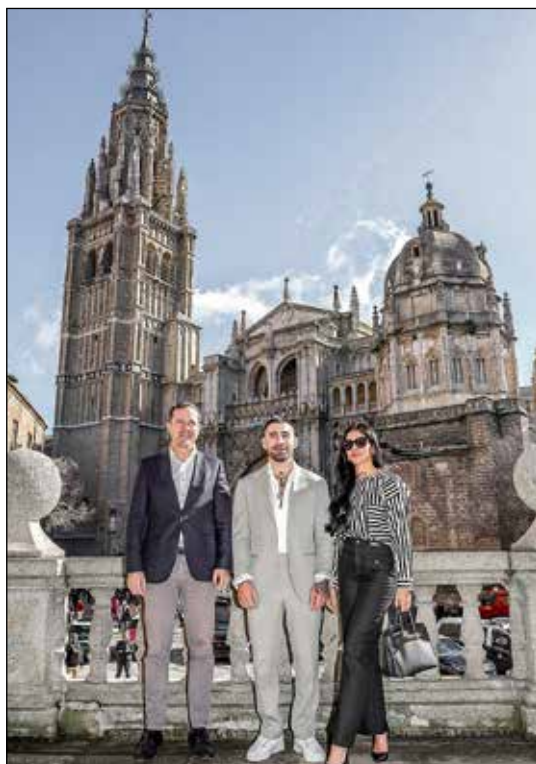
Tras la inauguración del pabellón San Lázaro rehabilitado, Ilia Topuria también participó en la inauguración del nuevo 'Paseo Ilia Topuria' y mantuvo un encuentro con jóvenes de la ciudad en el pabellón de la Escuela Central de Educación Física, consolidando su conexión con Toledo y su gente.

Topuria expresó su gratitud y emoción por el homenaje recibido, destacando su conexión con la ciudad. «Toledo no es grande solamente por su historia y por sus monumentos, es grande por el alma de su gente, es grande por todos vosotros», declaró el campeón. Además, comparó la estrategia de defensa de la ciudad con su propio estilo de lucha, lo que demuestra, según sus palabras «lo identificado que me siento con esta ciudad».