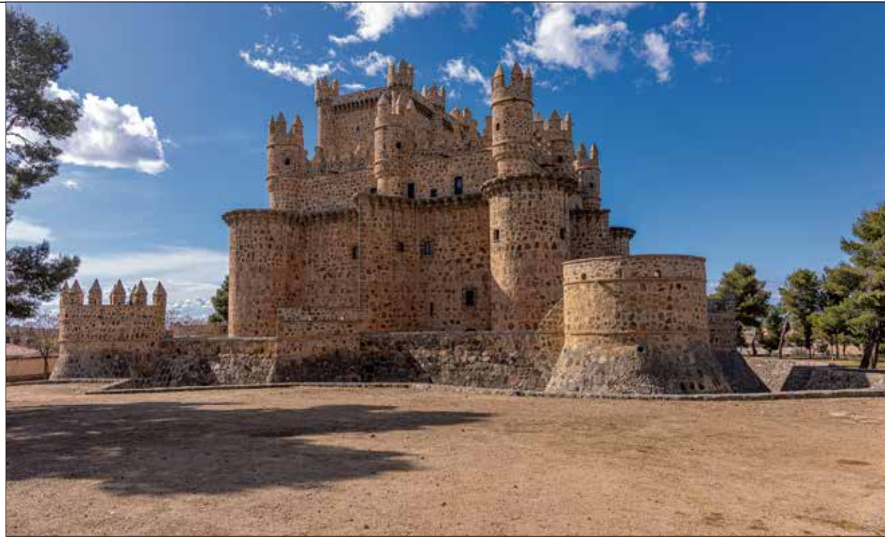
El Castillo de Guadamur, una joya medieval con historia y misterio cerca de Toledo.