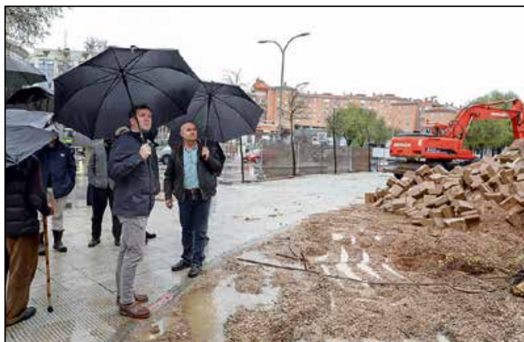
El alcalde de Toledo visitó el inicio de las obras del nuevo Centro de Mayores Buenavista, una demanda vecinal de más de 20 años.