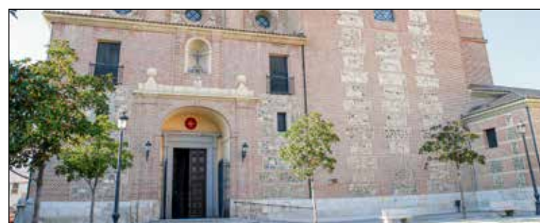
Santuario de Nuestra Señora de la Caridad de Illescas

En mayo, el protagonismo recaerá en el Festival Internacional de Magia 'Toledo Ilusión', que traerá a la ciudad a destacados magos del panorama actual. Así mismo, durante el mes de mayo se llevará a cabo el «Toledo Beat Festival», la décima edición del Festival Nacional de Teatro Universitario, una visita guiada a la senda ecológica dirigida a los jóvenes, y rutas nocturnas como 'Encuentro con el Toledo del Romance».