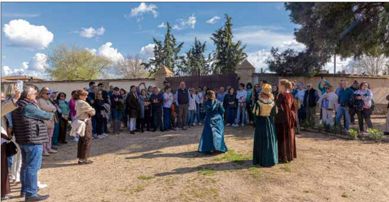
Los actores realizaron una fantástica representación, involucrando al público durante toda la visita.

centista. Destacan sus robustas torres cilíndricas, su imponente torre del homenaje y sus elaborados detalles decorativos, como los escudos heráldicos y las labores de perlas. El interior del castillo alberga colecciones de armaduras, tapices y muebles de época, ofreciendo a los visitantes una visión de la vida en la Edad Media y el Renacimiento. Aunque el Castillo de Guadamur es de propiedad privada y está habitado, se ofrecen visitas guiadas que permiten a los visitantes explorar áreas interiores específicas y conocer su fascinante historia.