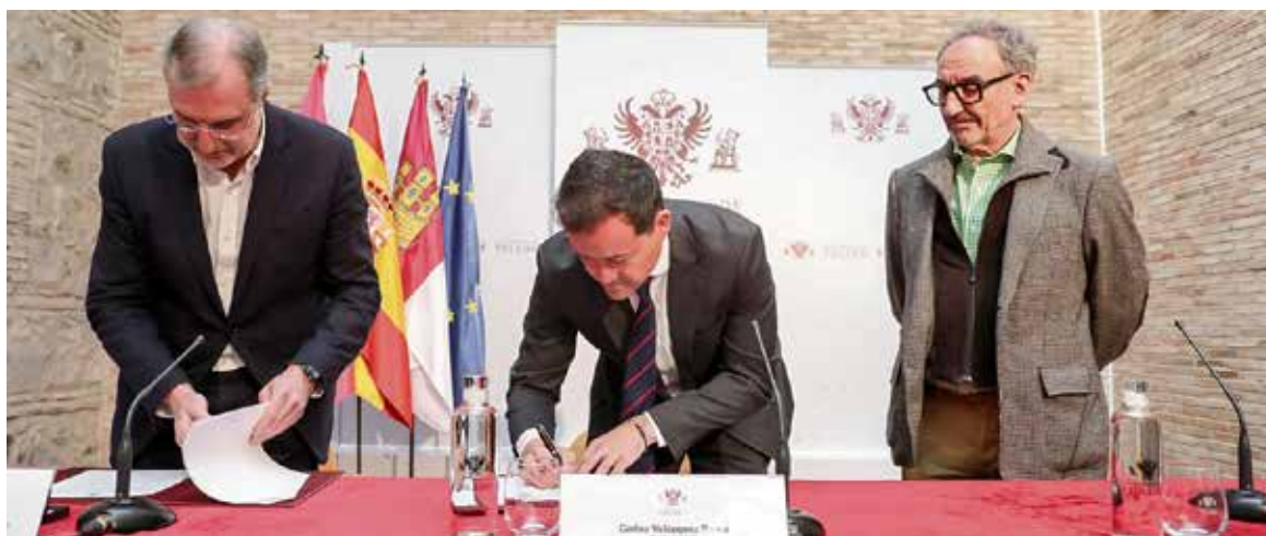
Este documento, fruto de la participación ciudadana y las reuniones mantenidas por el alcalde con diversos sectores, busca responder a las inquietudes de los toledanos.

Velázquez ha destacado la trascendencia de este proyecto, afirmando que con el nuevo POM Toledo «nos jugamos mucho, porque no es solo un documento, sino que es la mejor herramienta para planificar el futuro de la ciudad y para hacer realidad un proyecto de ciudad a medio y largo plazo». El alcalde ha insistido en que sacar adelante el POM era una «obligación y una responsabilidad» para su equipo de Gobierno, una postura que ya han