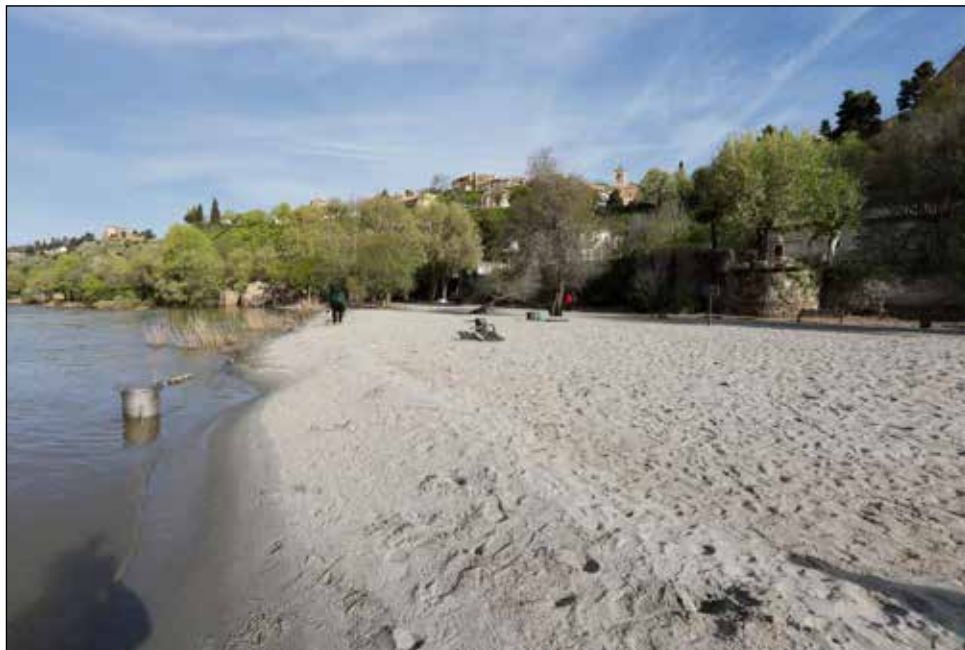
Vista de la playa fluvial formada en la ribera del río Tajo en Toledo.