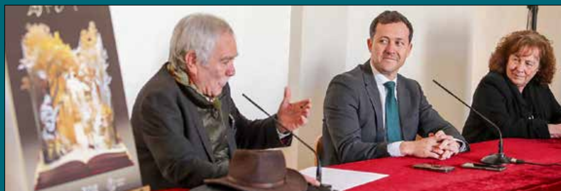
El II Ciclo de Novela Histórica 'Toledo, Luz de Europa', culminará con la entrega de un premio en una gran gala. Segunda edición se abrirá el próximo 24 de abril, a las 19:00 h con la conferencia 'Toledo 1212. Los ejércitos de las Navas' de Gonzalo Giner en el Corral de Don Diego, culminará con la entrega de un premio a toda una trayectoria en una gran gala.

Además del Circo Romano, Velázquez mencionó otras áreas de la muralla que requieren atención, como la zona de Recaredo, que se ha visto afectada por las recientes lluvias, así como los puentes de la ciudad. En definitiva, Velázquez, expresó su agradecimiento al Ministerio y al ministro por su interés en las cuestiones que afectan al patrimonio de la ciudad, reiterando la importancia de su preservación constante para las generaciones presentes y futuras.