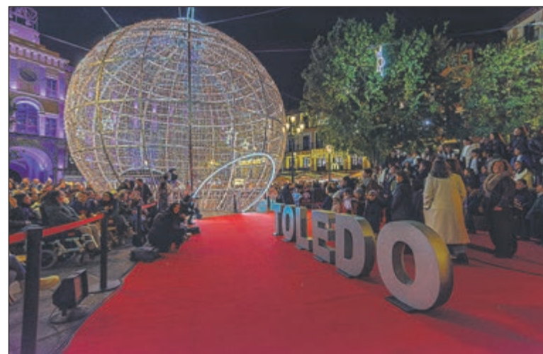
El dispositivo de seguridad diseñado para las fechas navideñas prioriza el acceso de los residentes a sus viviendas y establece itinerarios alternativos para descongestionar el eje Zocodover-Ayuntamiento.

El área afectada por esta regulación comprende el eje que une la plaza de Zocodover con la plaza del Ayuntamiento, transitando por las calles Comercio y Hombre de Palo. Esta última vía es el punto crítico donde se registra el mayor volumen de público.