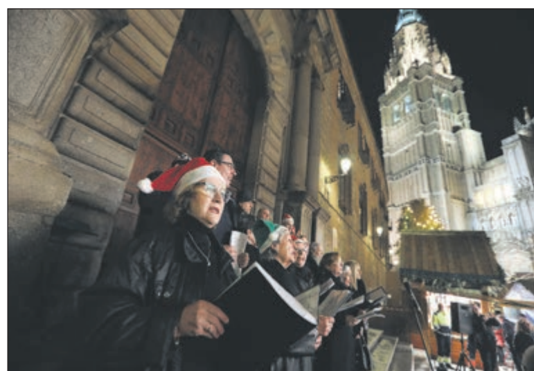
La Plaza del Ayuntamiento de Toledo ha vuelto a ser parada de la Ruta Solidaria 'Luces para mayores' impulsada por los taxistas de la ciudad.

El objetivo principal de esta iniciativa ha sido crear un espacio de encuentro tanto para los residentes como para los turistas. Según explicó el responsable municipal de Turismo, el evento buscaba ofrecer la oportunidad de «descubrir y apreciar la riqueza que tiene