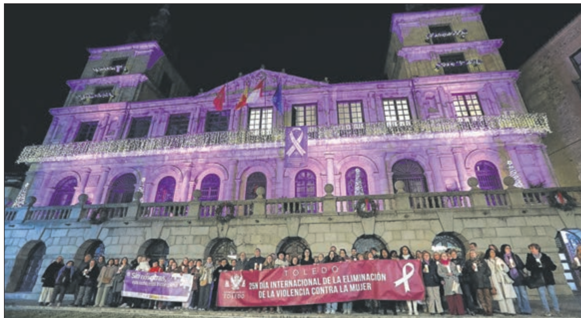
«Toledo no se rinde», ha subrayado el alcalde, al tiempo que ha indicado que «nos vamos a dejar la piel para que estos proyectos sean una realidad».

Durante su intervención, la concejala hizo hincapié en la gravedad de una violencia «que afecta a cualquier mujer por el simple hecho de serlo». En un tono solemne, recordó que, hasta la fecha del acto, 39 mujeres habían sido asesinadas en España a manos de sus parejas o exparejas en lo que va de año, una cifra que definió como «algo que no se puede consentir en una sociedad democrática».