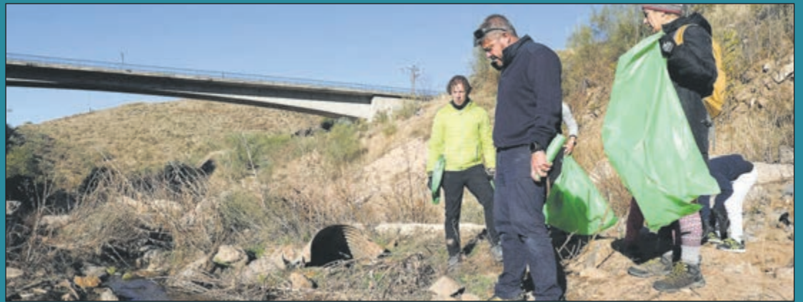
Éxito de la II Jornada de Basurala en el Valle y el entorno del Tajo. La jornada se ha centrado en la limpieza y recuperación ambiental de dos de los enclaves paisajísticos más emblemáticos y sensibles de la ciudad: los rodaderos del Valle y el entorno del Puente de San Martín.

«Toledo ha tenido un papel determinante en la historia de Europa y hoy vuelve a situarse en ese debate desde la cultura y el conocimiento», afirmó Arribas.