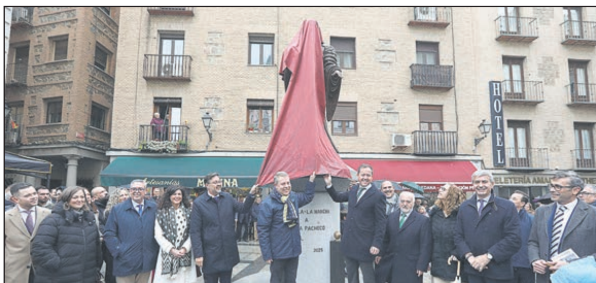
Con este homenaje, Toledo se convierte en la primera ciudad de España en tener estatuas dedicadas a ambos miembros de un matrimonio histórico, uniéndose a la de Juan de Padilla.