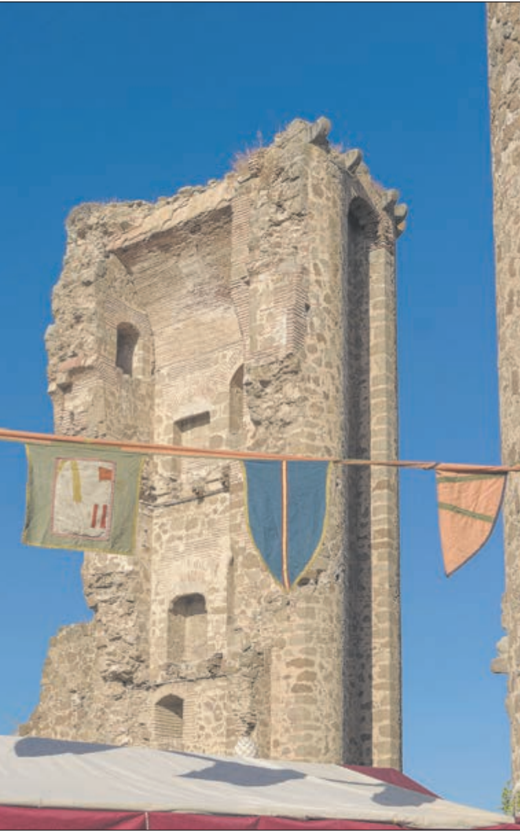
Hoy en día, el castillo de Polán se encuentra en estado de ruina consolidada. Solo se conservan vestigios de su antiguo esplendor, principalmente la fachada oeste, incompleta y rota por su centro, flanqueada por las dos imponentes torres que exhiben sus característicos estribos.

El castillo de Polán constituye el elemento patrimonial más significativo de la villa y una pieza de notable singularidad dentro de la arquitectura militar medieval de la península ibérica.