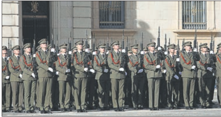
La jornada comenzó a primera hora de la mañana con la diana floreada, seguida del izado de bandera y una misa solemne, culminando con el desfile militar.