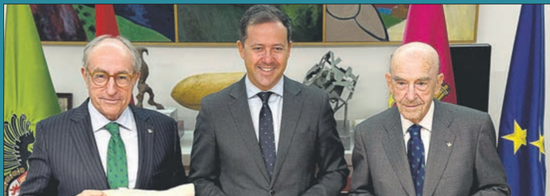
La canalización del arroyo Villagómez en Azucaica sextuplicará su capacidad de desagüe con una inversión de 3 millones. La actuación, que tendrá un recorrido soterrado de 1.125 metros hasta el Tajo, busca solucionar los problemas de inundaciones del barrio. La inversión total de las dos fases supera los tres millones de euros. Velázquez ha calificado la intervención como «la obra municipal más importante y necesaria en la historia de Azucaica».

El Ayuntamiento confía en que, al finalizar la campaña en la primavera de 2026, el censo arbóreo de Toledo haya experimentado un crecimiento significativo, consolidando la infraestructura verde como un elemento esencial de la planificación urbana municipal.