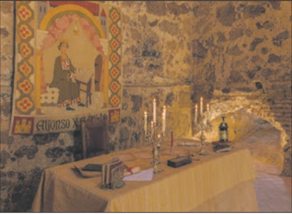
Lo que confiere al castillo de Polán un carácter excepcional son sus rasgos arquitectónicos, que lo diferencian de la mayoría de las fortalezas castellanas de su tiempo. La característica más distintiva son los contrafuertes o estribos exteriores curvos que refuerzan las torres, asemejando un pilar central rodeado de columnas adosadas.