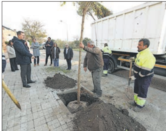
Toledo pone en marcha el tercer Plan de Arbolado. El Ayuntamiento plantará más de 2.000 ejemplares hasta abril de 2026 en Safont y en los barrios.