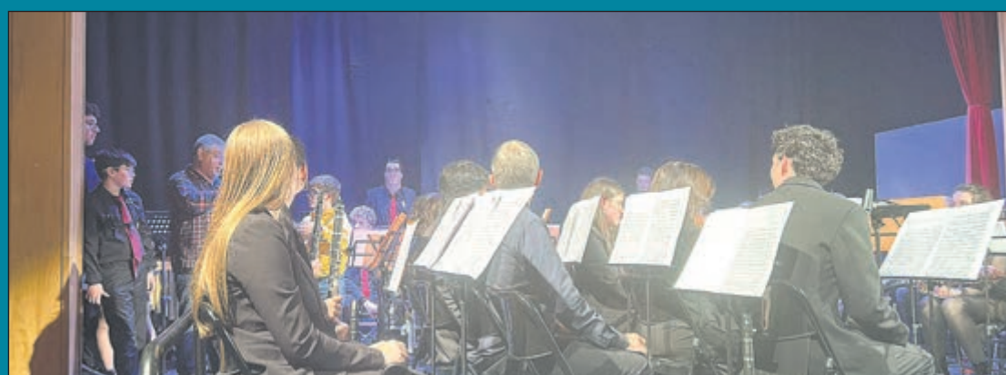
Concierto de Santa Cecilia. Para celebrar Santa Cecilia, patrona de la música, la Unión Musical de Cobisa ofreció un concierto espectacular lleno de emoción, talento y ese cariño especial que nuestra banda pone en cada actuación. Una tarde mágica en el Auditorio del Centro Cultural Alberto Sánchez, donde se pudo disfrutar de una programación cuidada y de una interpretación brillante.

Una cita deportiva que se celebrará el sábado 13 de diciembre, desde las 8:15 de la mañana y hasta la finalización del torneo, en las pistas de pádel del Recinto Ferial. Inscripciones gratuitas a través del correo: inscripción-deportiva@cobisa.es En el correo debéis incluir: Nombre y apellidos de cada miembro de la pareja y número de teléfono de ambos. Más información: 619 613 693 (WhatsApp)