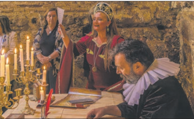
Lope de Zúñiga sería el siguiente personaje en aparecer en escena en el interior del torreón del Castillo, antes de pasar al que fue el patio de armas en donde la Asociación Baucan nos realizó una fantástica exhibición de lucha medieval.