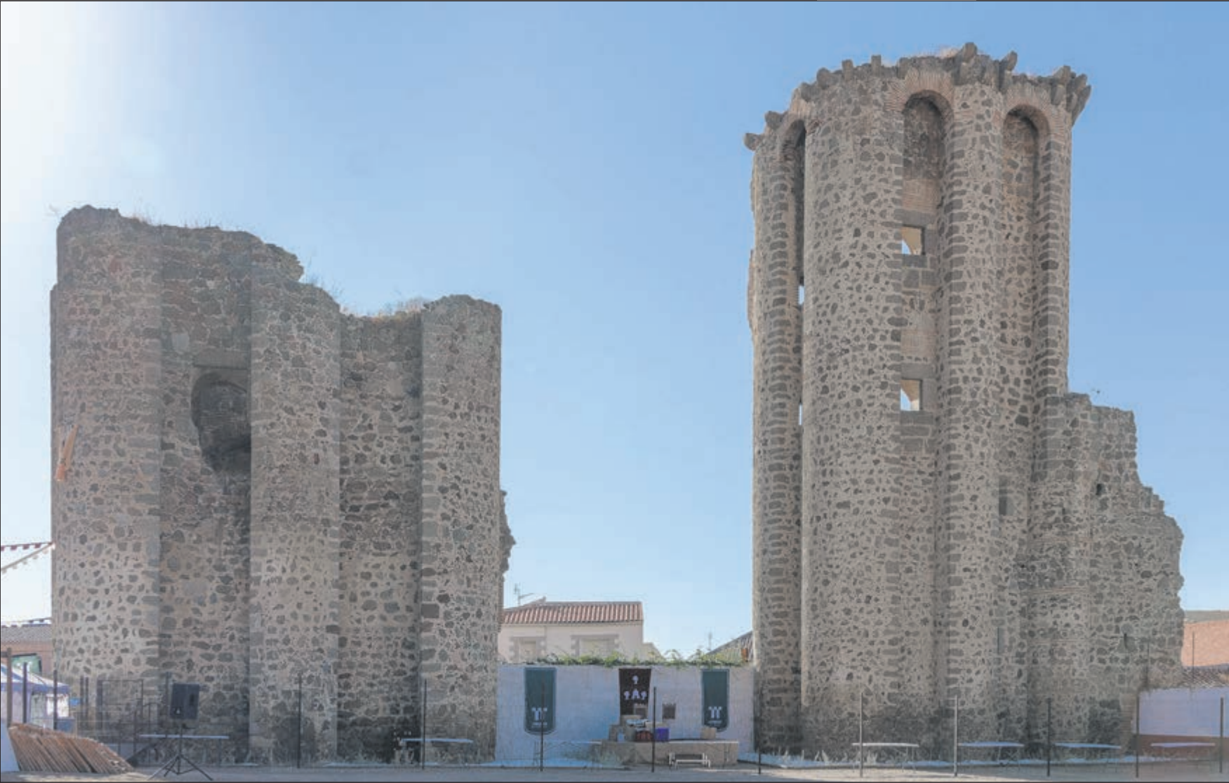
El Castillo de Polán, joya patrimonial de la provincia de Toledo, ha sido uno de los escenarios de una de las citas del exitoso programa de la Diputación de Toledo, ‘12 meses, 12 castillos, 12 experiencias’.