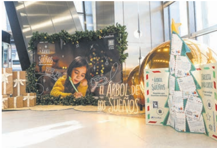
El programa, que cuenta con la colaboración de 29 entidades sociales locales, se encuentra en su recta final.

sumado a la iniciativa tienen de plazo hasta el próximo 12 de diciembre para depositar el regalo en su oficina de referencia. La organización ha establecido un límite económico máximo de 50 euros por obsequio para garantizar la viabilidad y equidad del