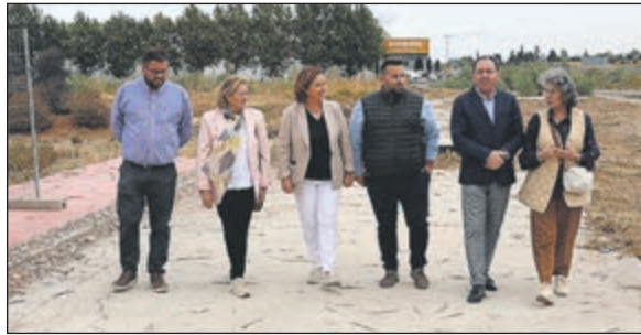
La obra, que cuenta con la financiación de la Diputación de Toledo, tiene como objetivo transformar una de las zonas más transitadas del municipio.

El proyecto técnico presentado contempla una intervención integral que va más allá de la simple