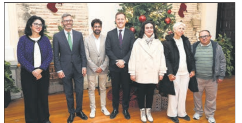
La candidatura toledana refuerza uno de sus principales pilares: el carácter social e inclusivo de la propuesta.