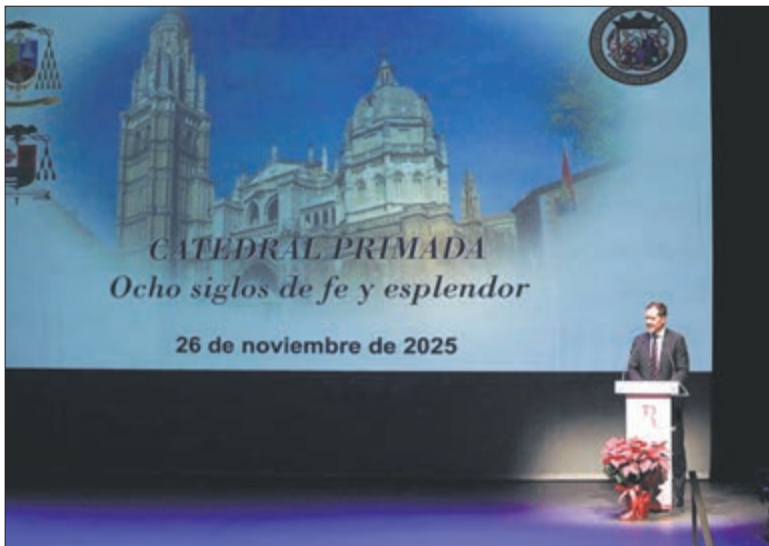
El alcalde de Toledo ha puesto de relieve el significado especial de la fecha elegida para el estreno del documental, el 26 de noviembre, «día en el que justo hace 39 años Toledo era declarada Patrimonio de la Humanidad por la UNESCO».

Este nuevo documental de la Catedral Primada tiene como objetivo conmemorar los ochocientos años de vida de una de las joyas patrimoniales más relevantes de España. Durante su intervención, el regidor municipal subrayó la satisfacción que supone para el Ayuntamiento participar en la difusión de este proyecto. Según destacó Velázquez, la cinta ofrece una perspectiva novedosa, permitiendo a los espectadores descubrir el templo «desde un punto de vista hasta ahora desconocido».