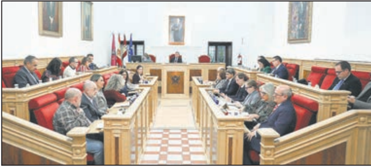
Pleno del Ayuntamiento de Toledo.