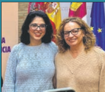
las barreras que enfrentan las mujeres con discapacidad intelectual.

El Ayuntamiento fue escenario de una importante jornada de reflexión y formación bajo el título 'Sin nosotras esta lucha está incompleta'. Este encuentro, organizado en colaboración con Plena Inclusión y enmarcado en la programación extendida de las actividades del 25N (Día Internacional de la Eliminación de la Violencia contra la Mujer), ha servido para poner el foco en una realidad a menudo invisibilizada: la situación de vulnerabilidad y