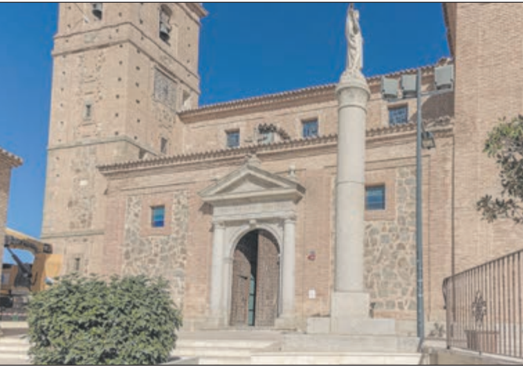
El principal foco religioso y artístico de la villa es la Iglesia Parroquial de San Pedro y San Pablo. Construida en el siglo XVIII bajo el cardenalato de Lorenzana, el templo es un notable ejemplo de la arquitectura tardobarroca con elementos de estilo rococó. La joya más preciada que alberga la iglesia parroquial es, sin duda, un lienzo de La Piedad pintado por el maestro extremeño del siglo XVI Luis de Morales, apodado «El Divino» por la intensa espiritualidad de sus obras.