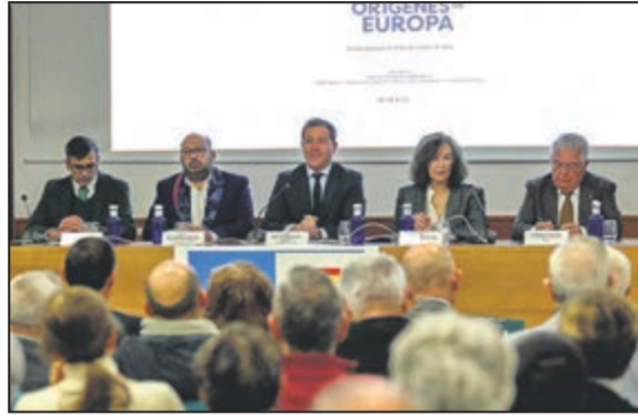
San Clemente acogió el Seminario Internacional Orígenes de Europa. Expertos han analizado la transición a la Edad Media y el papel histórico de Toledo.

Por otro lado, la cultura ha protagonizado el único acuerdo unánime de la jornada. Todos los grupos políticos han votado a favor de la moción de IU-Podemos para establecer descuentos del 50% en el Teatro de Rojas y otros espacios escénicos municipales para jóvenes de entre 14 y 30 años.