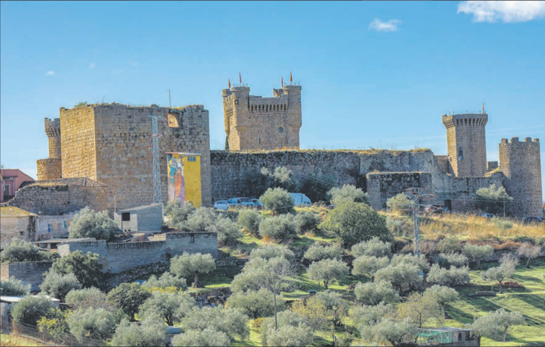
El Castillo de Oropesa, joya patrimonial de la provincia de Toledo, ha sido uno de los últimos escenarios del exitoso programa de la Diputación de Toledo, ‘12 meses, 12 castillos, 12 experiencias’.