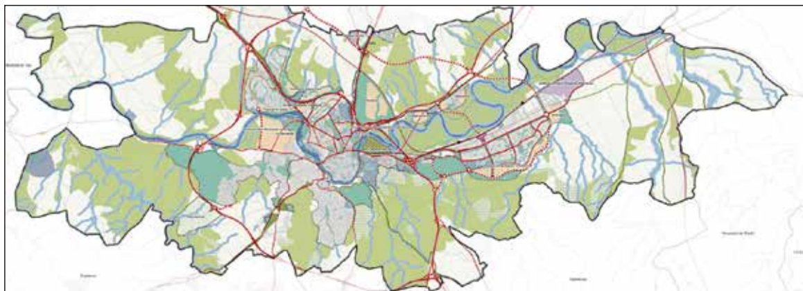
Toledo pone en marcha el tercer Plan de Arbolado. El Ayuntamiento plantará más de 2.000 ejemplares hasta abril de 2026 en Safont y en los barrios.