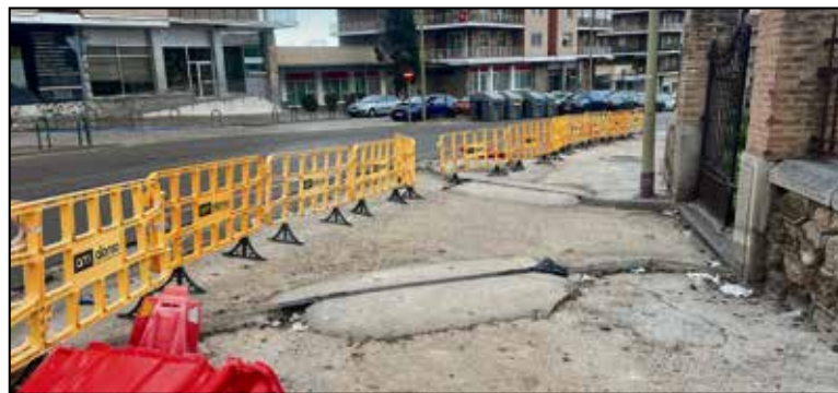
Estado de las obras en la calle Duque de Lerma.