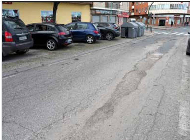
Estado actual de una de las calles que serán renovadas dentro del Plan Asfalto 2026 anunciado por el Ayuntamiento.

El Ayuntamiento de Toledo ha quedado excluido del reparto de las ayudas europeas destinadas al desarrollo sostenible de las entidades locales, según la resolución definitiva hecha pública el pasado mes de diciembre. Ante este escenario, el alcalde Carlos Velázquez ha anunciado la interposición de un recurso ante los tribunales. El regidor sostiene que la exclusión de Toledo contraviene las bases reguladoras de la convocatoria y ha calificado la decisión como “completamente injusta.”