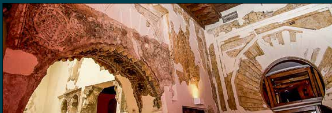
El Ministerio de Cultura cede la Casa del Temple, tesoro andalusí toledano, a la Fundación de Cultura Islámica. Se trata de un edificio medieval, construido entre los siglos XI y XVI en la calle Soledad, número 2 de la capital toledana y que perteneció a los caballeros templarios.

El Teatro de Rojas, también cobraba protagonismo en el discurso, dado que el «coliseo de las Bellas Artes toledanas» conmemora su 450 aniversario en este 2026. Velázquez avanzaba que el recinto recibirá el próximo 20 de enero a los Reyes de España para la entrega de las Medallas de Oro al Mérito en las Bellas Artes, uno de los eventos culturales más relevantes del año.