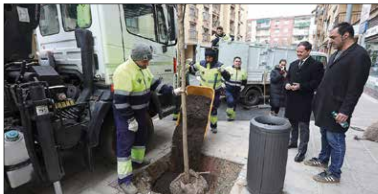
Se han utilizado especies autóctonas con su correspondiente sistema de riego para garantizar su crecimiento.

Esta última vía destaca por ser el eje principal de conexión peatonal entre el barrio residencial y el Campus Universitario de la Fábrica de Armas. La intervención busca dotar de sombra y valor medioambiental a un trayecto transitado diariamente por numerosos estudiantes y vecinos. Según ha informado el regidor municipal,