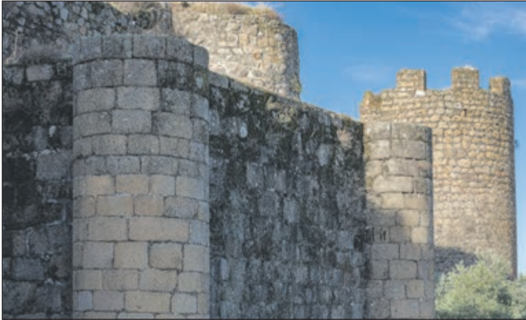
La historia del Castillo de Oropesa es la de sus múltiples vidas. No es una simple “foto” de la Edad Media; es una importante muestra en la que cada época ha escrito sobre la anterior sin borrarla del todo.