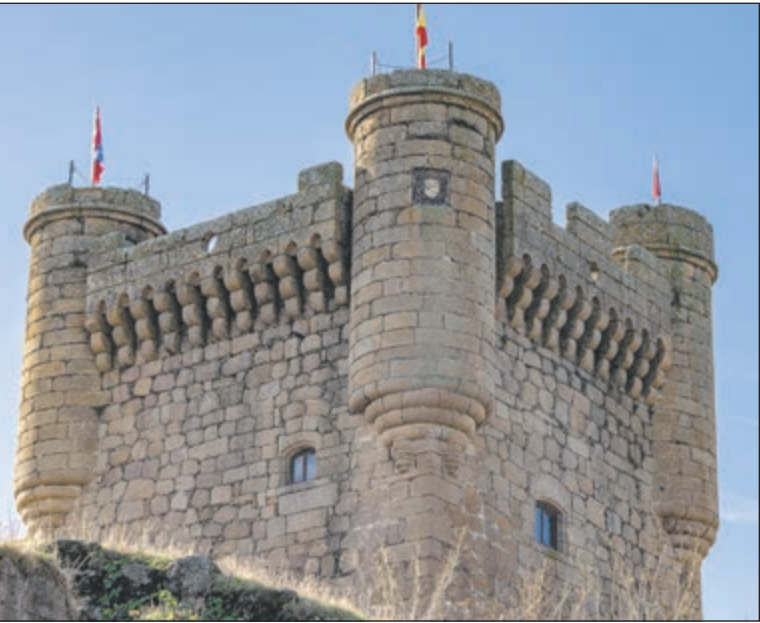
El complejo actual se define por la dualidad entre el Castillo Viejo y el Castillo Nuevo. A partir de 1402, la familia Álvarez de Toledo impulsó la construcción de un palacio gótico adosado a la antigua estructura árabe, transformando el recinto militar en una residencia señorial y administrativa.