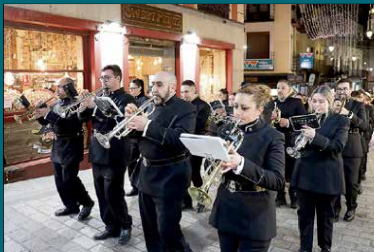
Éxito del Certamen solidario de Bandas. En esta ocasión el Certamen contará con la participación de dos destacadas formaciones musicales, la Agrupación Musical San Miguel Arcángel de Puertollano (Ciudad Real), una formación joven que será, además, “la encargada del acompañamiento musical de la Hermandad el próximo Miércoles Santo”; y la Banda de Música Santa Ana de Dos Hermanas (Sevilla).

Desde el Ayuntamiento de Toledo se ha solicitado comprensión a la ciudadanía ante las inevitables molestias que estas actuaciones de mejora urbana están ocasionando en el día a día. Las autoridades municipales recomiendan a los conductores que planifiquen sus desplazamientos con suficiente antelación para evitar retenciones en horas punta.