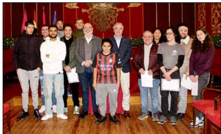
El Ayuntamiento de Toledo clausura el primer Programa de Capacitación Juvenil con 12 alumnos y anuncia una segunda edición para 2026 tras invertir 152.000 euros.

Los participantes han dedicado los últimos ocho meses a recibir una formación integral que ha combinado teoría y práctica en el ámbito de la edificación y la obra civil. El resultado de este aprendizaje ha quedado plasmado en intervenciones reales en el espacio público.