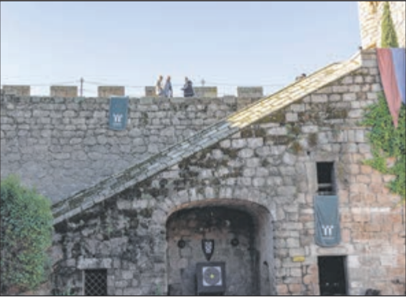
La fortaleza toledana, erigida sobre antiguos cimientos romanos y árabes, consolidó el poder del linaje Álvarez de Toledo y se convirtió en el siglo XX en el primer edificio monumental destinado al turismo estatal.