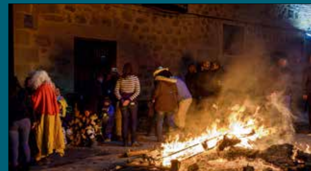
La procesión y la bendición de los animales dará paso a las luminarias. Gálvez verá iluminarse la noche con cientos de hogueras.