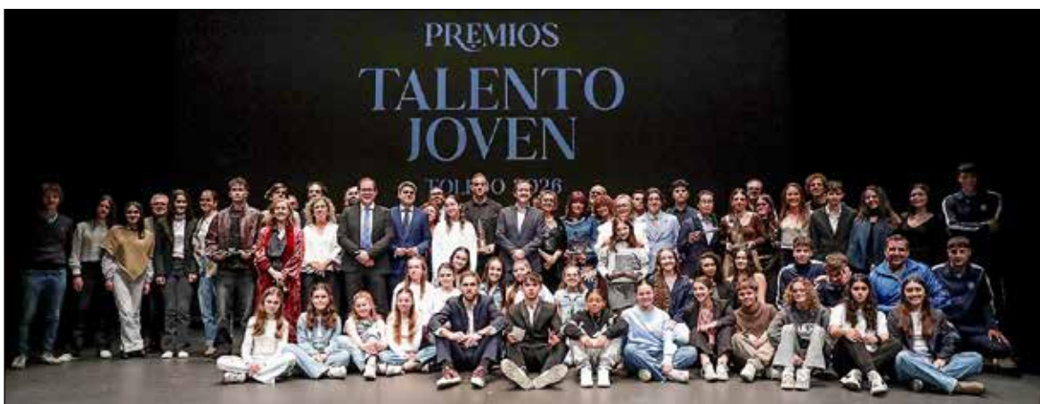
El alcalde ha vinculado la celebración de estos Premios Talento Joven con el próximo 40 aniversario de la declaración de Toledo como Ciudad Patrimonio de la Humanidad por la UNESCO.

El alcalde vinculaba la celebración de estos Premios Talento Joven con el próximo 40 aniversario de la declaración de Toledo como