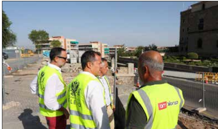
Se prevé que esta situación se mantenga durante al menos tres meses. Desde el Ayuntamiento se recomienda planificar los desplazamientos

La principal modificación consiste en la reducción de la capacidad de la vía, que ha pasado de disponer de cuatro carriles de circulación a contar únicamente con dos operativos. Según el esquema de movilidad establecido, se ha habilitado un solo carril de