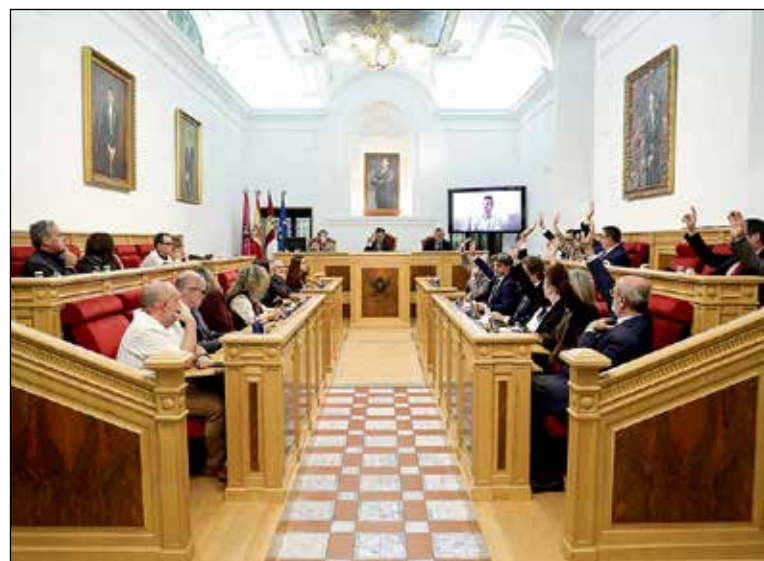
Pleno del Ayuntamiento de Toledo.

Sin embargo, el dato más relevante de este ejercicio es el “fuerte impulso” a las inversiones reales, que registran un aumento histórico del 155,37%. Esta subida permitirá acometer proyectos de gran envergadura y mejoras en infraestructuras demandadas por los vecinos. Asimismo, se ha dotado de mayor seguridad a las cuentas mediante un incremento del 63,55% en el fondo de contingencia, previsto para afrontar posibles imprevistos a lo largo del año.