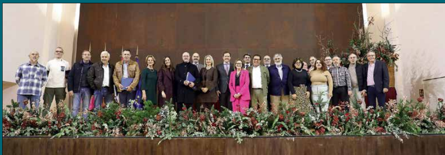
Acto de Homenaje a los trabajadores municipales jubilados. El alcalde de Toledo, Carlos Velázquez, acompañado por los portavoces de los grupos políticos, ha presidido recientemente el acto de reconocimiento a los empleados públicos que finalizaron su etapa laboral durante el pasado año. La ceremonia, celebrada en el Centro Cultural San Marcos, ha servido para poner en valor la dedicación y la vocación de servicio público de la plantilla municipal.

El proyecto de reforestación urbana se extiende más allá de Santa Teresa. El Ayuntamiento está recuperando alcorques que permanecían vacíos y realizando plantaciones en parques y áreas verdes de toda la ciudad, incluyendo una actuación significativa en la zona de Safont con mil ejemplares. El objetivo del gobierno local es recuperar zonas en desuso y mejorar el entorno urbano. “Es un camino al que no renunciamos”, ha concluido Velázquez, reafirmando la continuidad de estas labores.