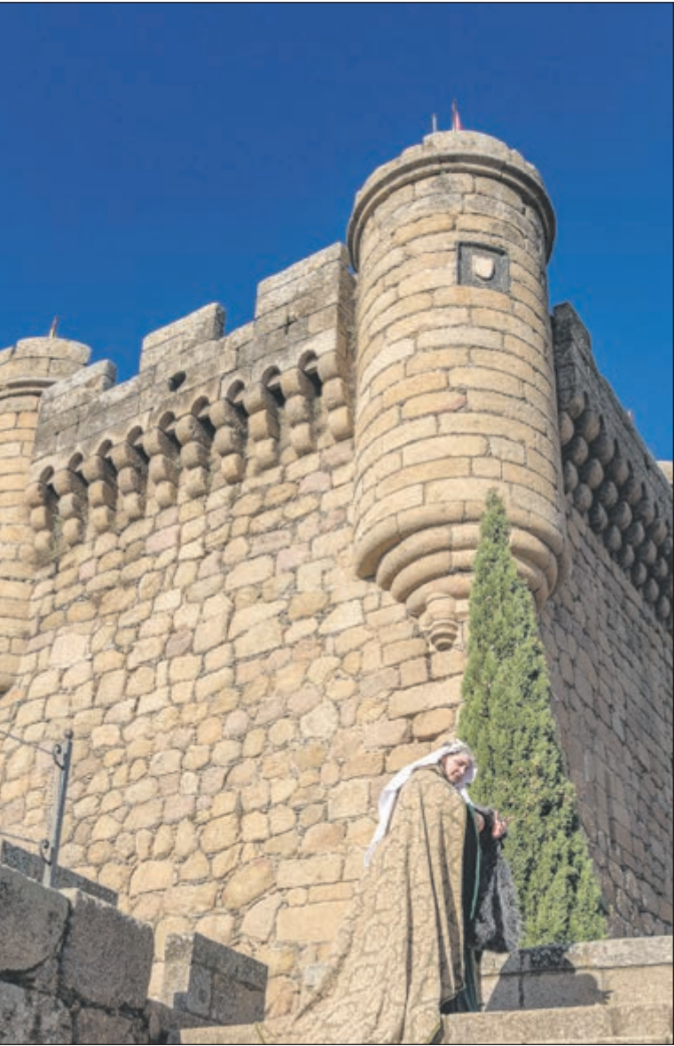
El complejo está formado por el “Castillo Viejo”, una fortaleza de origen árabe de los siglos XII y XIII, y el “Castillo Nuevo” o Palacio Condal, una imponente construcción gótica iniciada hacia 1402. Juntos, narran la historia de una metamorfosis: la transformación de un enclave puramente militar en la sede de uno de los linajes más influyentes de Castilla, los Álvarez de Toledo.

El Castillo de Oropesa se erige como uno de los conjuntos de fortaleza-palacio más significativos y visualmente impactantes de Castilla-La Mancha.