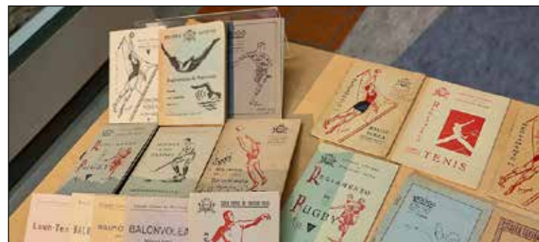
La exposición se convierte en un recurso de consulta para investigadores, estudiantes de ciencias del deporte, historiadores y cualquier aficionado.