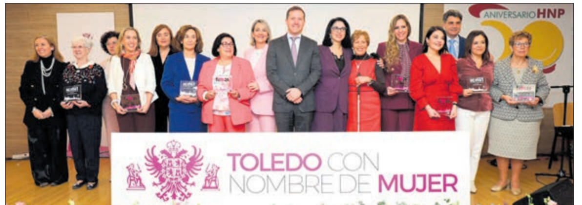
Toledo celebró el 8M con la entrega de los premios Toledo con nombre de mujer, reconociendo el talento de diez figuras clave de la ciudad.