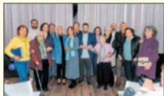
Burguillos homenajea a sus «Mujeres Referentes» en una emotiva gala PÁGINA 24