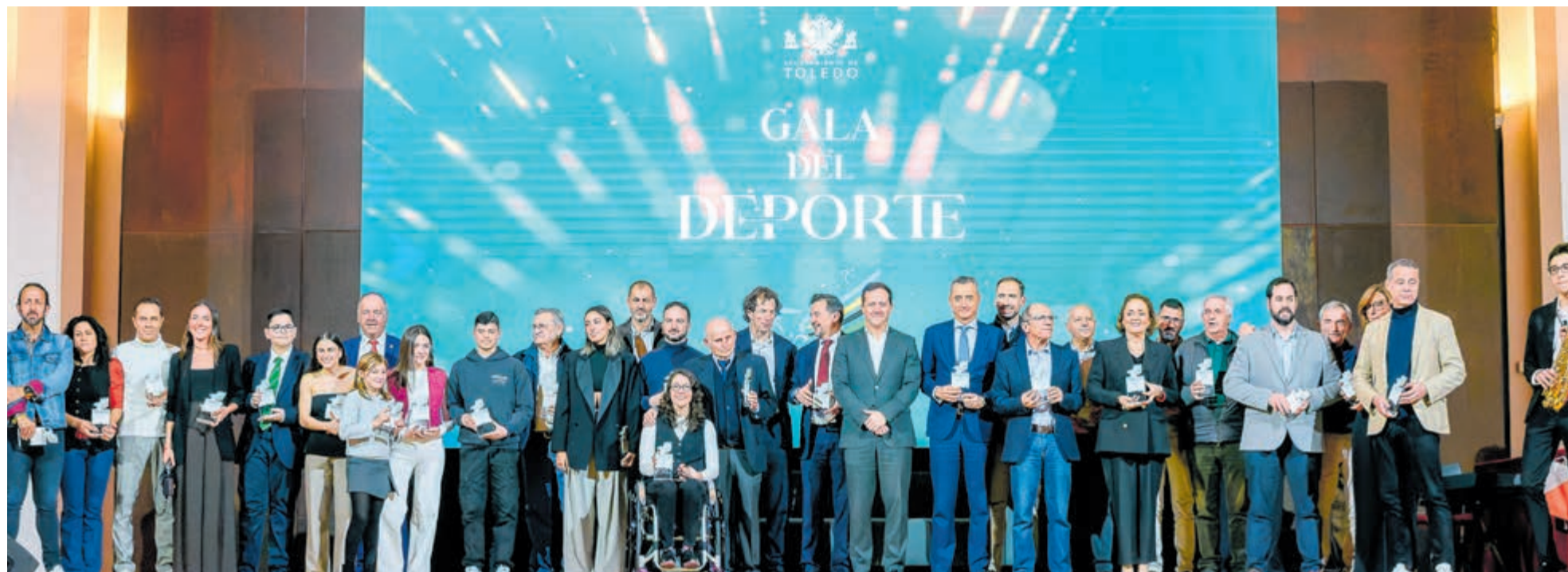
Durante el acto, se premió la trayectoria de figuras históricas y jóvenes promesas que llevan el nombre de Toledo a lo más alto en competiciones internacionales.