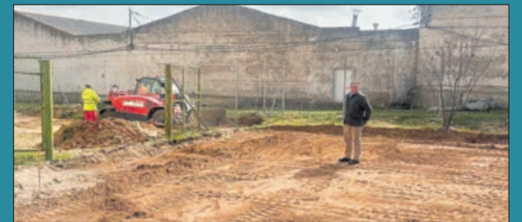
Mejora y acondicionamiento del silo multiusos. El consistorio galveño continúa trabajando en la pavimentación de los exteriores y ajardinamiento del Silo.

la de consolación. El Torneo de Petanca Primavera 2026 iniciará su actividad a las 8:00 horas con la apertura de la mesa de inscripciones, periodo que se extenderá hasta las 9:00 horas en el mismo Parque de los Caños.