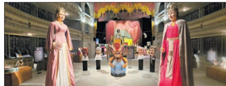
La exhibición ha contado con casi un centenar de piezas artesanales que muestran la evolución de títeres, máscaras y marionetas desde el siglo XI.

La sostenibilidad es el eje vertebrador de esta propuesta de 'Toledo Ciudad Creativa'. Los prototipos integrarán materiales de bajo impacto ambiental y sistemas de economía circular para optimizar su transporte y almacenamiento.