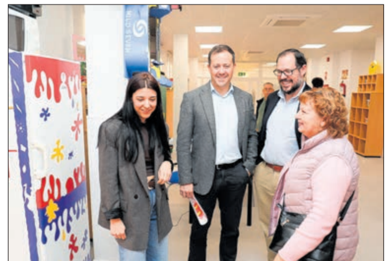
El alcalde de Toledo, Carlos Velázquez, y el concejal de Educación, Daniel Morcillo, inauguraron la ludoteca del barrio de Santa Bárbara

Con la finalización de estos trabajos, el Ayuntamiento de Toledo ha completado una de las actuaciones de mejora de infraestructuras educativas y culturales previstas para la presente anualidad en el barrio de Santa Bárbara. Las instalaciones se encuentran actualmente en pleno funcionamiento.