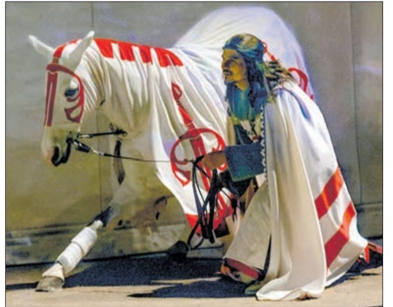
El espectáculo nocturno 'El Sueño de Toledo', considerado el más grande de España, retomará sus funciones el próximo 19 de marzo.