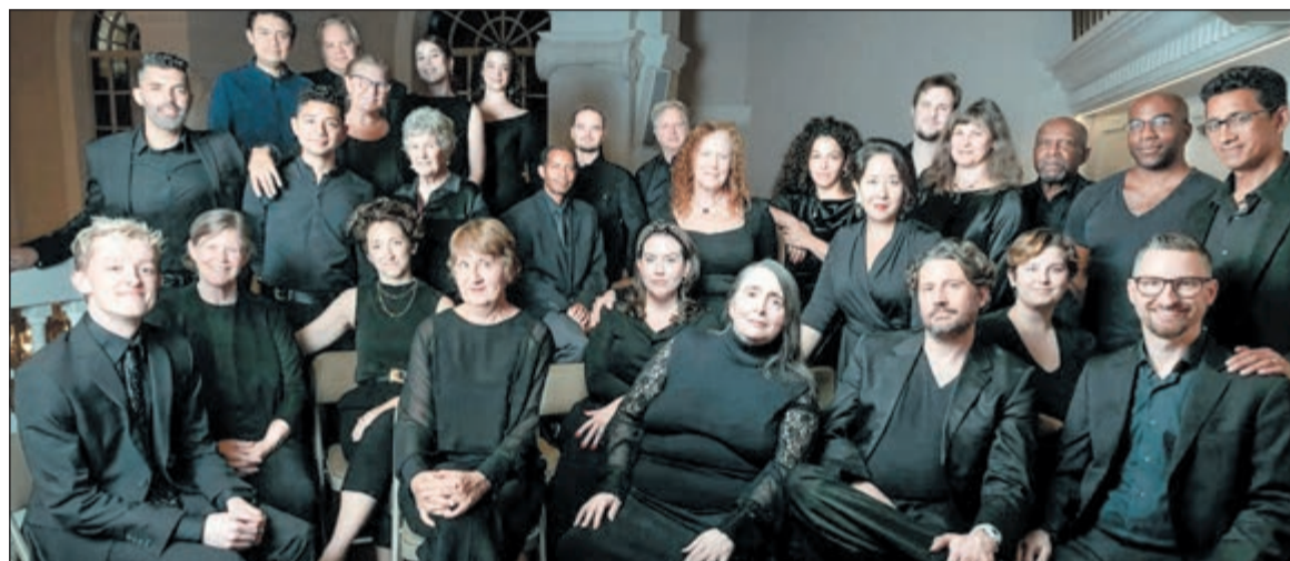
El Coro Música Viva Nueva York, actúa por primera vez en España.

El eje central de la velada será la interpretación de Path of Miracles (El camino), compuesta en 2005 por el británico Joby Talbot. Esta obra coral está estructurada en cuatro movimientos que recrean las etapas principales del Camino de Santiago: Roncesvalles, Burgos, León y Santiago de Compostela. La composición busca