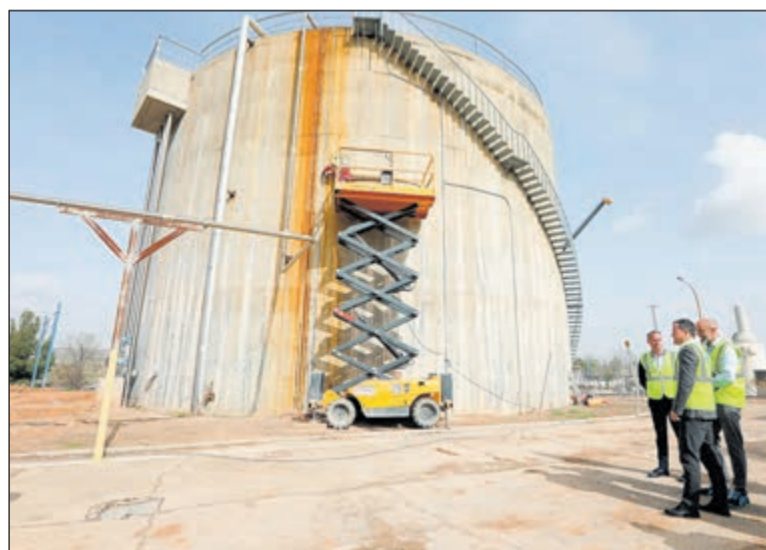
Toledo invierte 3 millones de euros en renovar la depuradora de Santa María de Benquerencia para eliminar los vertidos contaminantes al río Tajo.

Esta reforma integral responde a la necesidad de revertir la situación medioambiental del entorno. Entre 2021 y marzo de