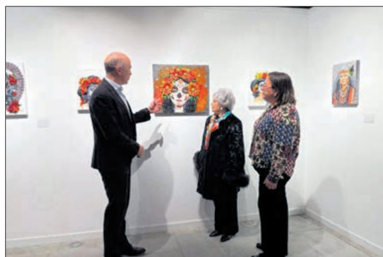
La exposición «Miradas de rostros femeninos» forma parte de la programación cultural impulsada por la Diputación Provincial de Toledo.