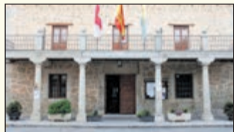
Gálvez cierra el ejercicio económico 2025 con deuda cero PÁGINA 27