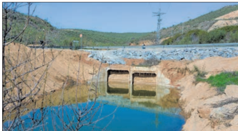
Los trabajos han permitido retirar 3.000 metros cúbicos de lodo y residuos que bloqueaban el cauce.

Desde el Consistorio se ha subrayado que esta acción se ha realizado con carácter de urgencia para evitar riesgos estructurales en la calzada, especialmente debido al intenso tránsito de vehículos pesados que registra el Ca-