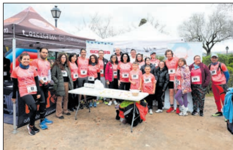
El Ayuntamiento reafirma su compromiso con la igualdad tras un mes intenso con 24 actividades de sensibilización y el trabajo continuo de la Escuela Toledana de Igualdad.