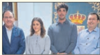
Nuevos agentes y medidas de vigilancia para mejorar la seguridad en Argés PÁGINA 23

EL PERIÓDICO DE TOLEDO y ALREDEDORES • EDICIÓN GRATUITA MENSUAL • Número 69 • Marzo 2026