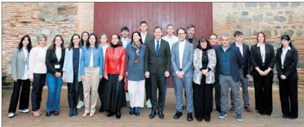
El objetivo de este 25 aniversario es seguir protegiendo el patrimonio de la ciudad y hacerlo más habitable y humano para todos los vecinos.

La programación del 25 aniversario arranca este fin de semana, los días 14 y 15 de marzo, con unas jornadas de puertas abiertas centradas en alminares y to-