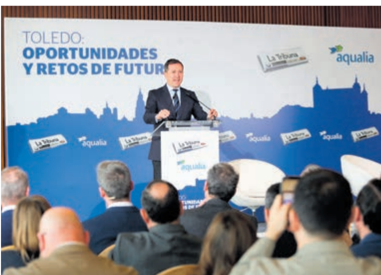
Velázquez explicaba que esta decisión permitirá, a su vez, dar un nuevo destino al antiguo edificio de Radio Nacional de España.

señada específicamente para el espacio acústico de la Catedral de Toledo. Además, se pondrá en marcha un programa educativo orientado al público infantil y juvenil, así como un Simposio Internacional de Musicología. Estas acciones pretenden que la efeméride del VIII Centenario deje una herencia cultural permanente en la ciudad, consolidando su posición como centro de referencia para la música sacra y académica en Europa.