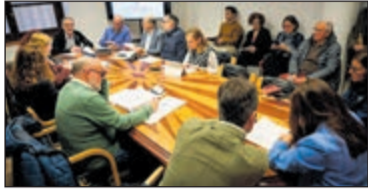
Comisión de urbanismo