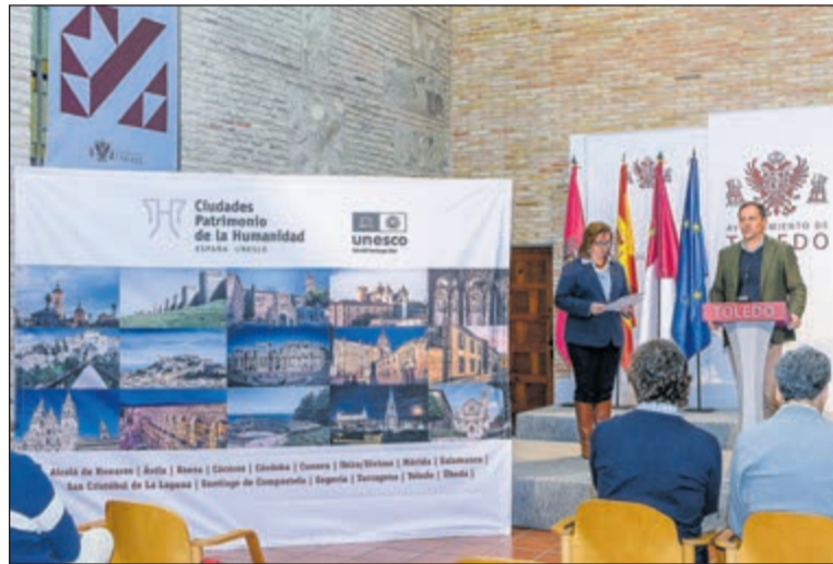
Velázquez destacó que este circuito combina la promoción del patrimonio histórico con la práctica deportiva y los hábitos de vida saludable.

El circuito está formado por quince pruebas que se cele-