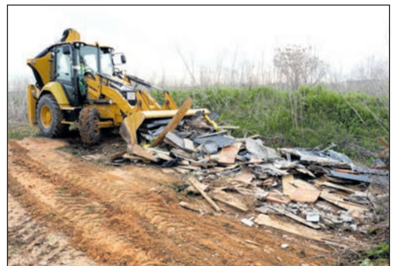
Tras identificar nuevos focos de contaminación, se han ejecutado intervenciones recientes para sanear el entorno fluvial.

Con el impulso del Plan de Vertidos Cero, la administración local busca garantizar que el río Tajo y sus márgenes recuperen su valor ecológico y social. Estas actuaciones de saneamiento son fundamentales para cumplir con los estándares medioambientales y ofrecer un espacio cuidado y saludable, reafirmando la sostenibilidad como eje vertebrador de la gestión del entorno fluvial.