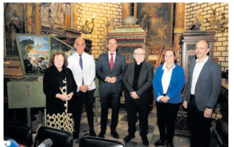
Las Batallas de Órganos regresan a la Catedral de Toledo con la novedad de la Lira del Cielo y la participación de destacados organistas internacionales.

La programación continuará el 25 de abril con la celebración de la XXX edición de las Batallas de Órganos, cuya temática central será la festividad del Corpus Christi de Toledo.