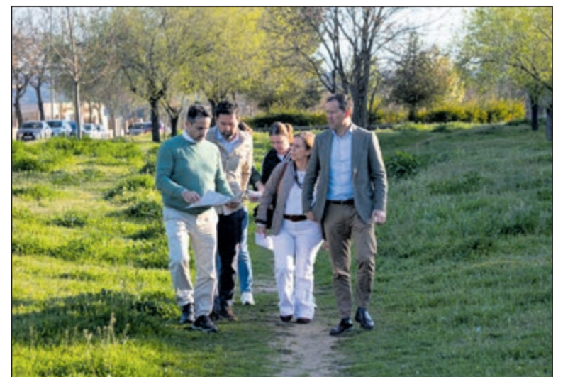
Valparaíso contará con una nueva infraestructura deportiva y una zona de picnic, además de 40 nuevos árboles tras el inicio de las obras.

Con el desarrollo de esta infraestructura, el consistorio reafirma su compromiso con la mejora de los servicios en los distintos barrios de la ciudad.