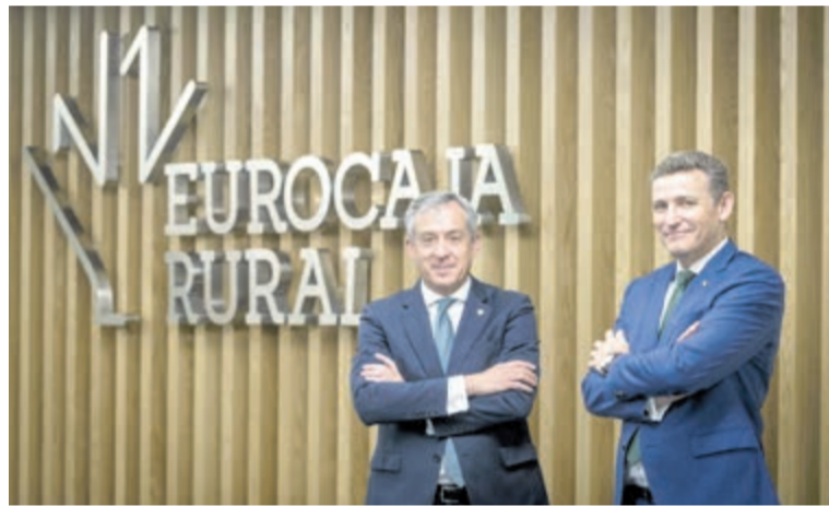
El presidente de Eurocaja Rural, Javier López Martín y el director general de la institución, Víctor Manuel Martín López

La concesión de crédito ha sido uno de los motores principales de la actividad. En total, se formalizaron 24.645 nuevas operaciones de financiación por un montante global de 2.679 millones de euros. Dentro de estas cifras, destaca el segmento hipotecario, donde la entidad ha gestionado 8.673 operaciones por