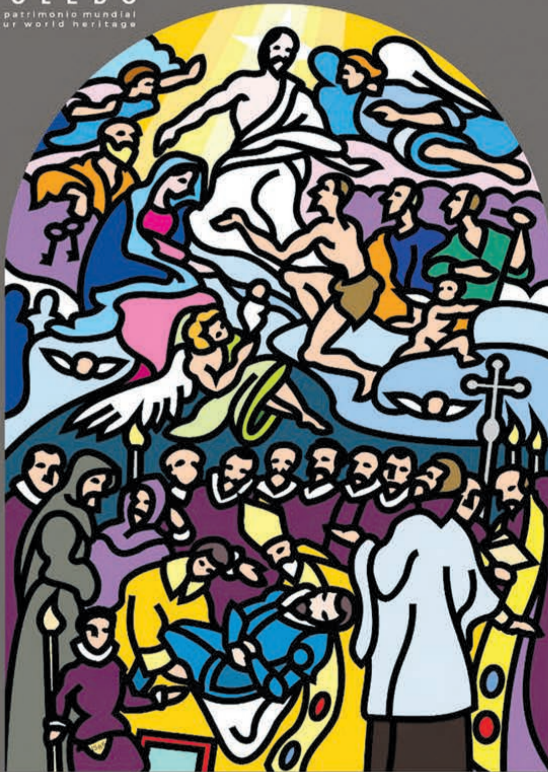
"EL ENTIERRO DEL SEÑOR DE ORGAZ". EL GRECO