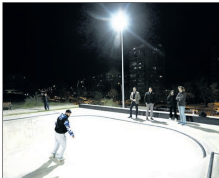
Esta actuación se suma a otras recientes como la nueva pista de pádel en la Escuela de Educación Física o las mejoras en Valparaíso.

Con la implementación de los nuevos proyectores LED, el consistorio busca optimizar las infraestructuras existentes y fomentar hábitos de vida saludables en el Polígono. Lozano ha subrayado que, gracias a esta mejora en el skatepark y el parque de calistenia, los usuarios podrán extender sus entrenamientos más allá de las seis o siete de la tarde. Esta iniciativa se enmarca en la estrategia de 2026 para rehabilitar y construir espacios que hagan más accesible la actividad física en todos los barrios de la capital.