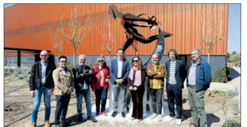
El complejo deportivo cuenta ahora con una nueva escultura que une arte y deporte, realizada por la Escuela de Arte de Toledo.