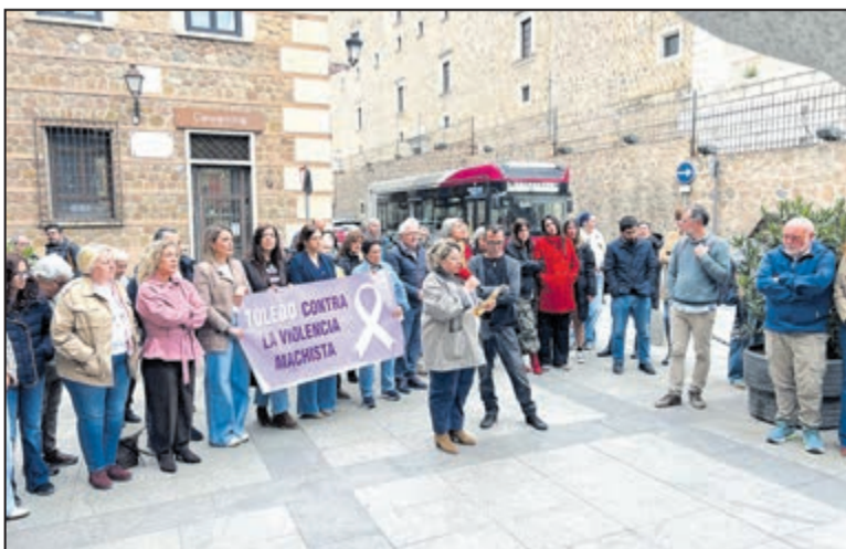
El Grupo Municipal Socialista de Toledo refuerza su postura contra la violencia machista en la concentración mensual del Consejo Local de la Mujer.

Finalmente, el grupo municipal ha reafirmado su compromiso con la defensa de los derechos de las mujeres y sus hijos. La formación ha asegurado que mantendrá su presencia y apoyo activo en cada acción que busque erradicar la violencia machista en la ciudad, insistiendo en la urgencia de frenar las estadísticas actuales para garantizar una convivencia segura.