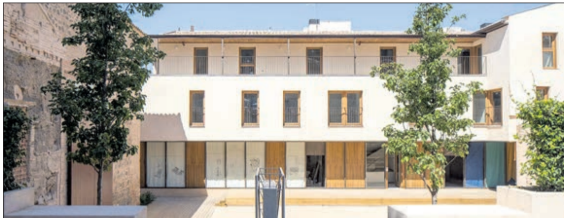
Con alquileres accesibles y sistemas de eficiencia energética, estas viviendas permiten que nuevas familias apuesten por vivir en el Casco Histórico.

La gestión de este proyecto se llevó a cabo a través de la Empresa