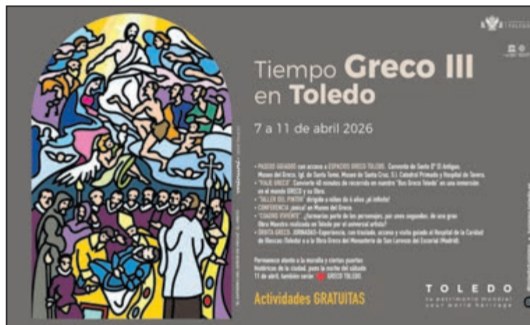
Cartel de la programación de 'Tiempo Greco'

Una de las incorporaciones más destacadas de este año es el 'Cuadro viviente', una representación teatral en la que diversos actores recrearán en directo una de las obras del Greco. Esta propuesta permitirá que los asistentes se integren en la escena, convirtiendo la observación artística en una experiencia participativa. Además, el programa Tiempo