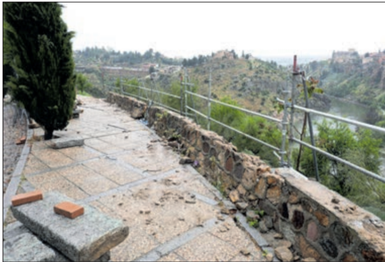
Dan comienzo las obras de reparación en los muros de la ronda del Valle.

La intervención técnica se está llevando a cabo íntegramente con fondos propios del presupuesto municipal. Molina ha calificado la reparación de los muros del Valle como una medida de urgente necesidad que había sido postergada en ejercicios anteriores.