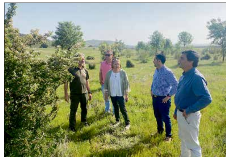
La Diputación de Toledo reafirma su compromiso con la protección del medio natural y la sensibilización a través de equipamientos especializados.

Finalmente, la Diputación de Toledo ha reafirmado su intención de seguir apoyando estos equipamientos especializados.