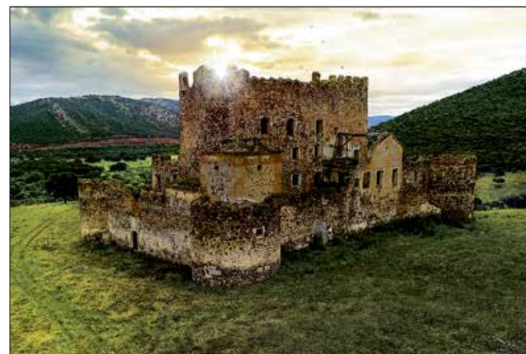
El Castillo de Guadalerzas revivirá su historia con el programa 12 meses, 12 castillos con una visita en la que Patrimonio y senderismo se dan la mano.

Tras la inmersión histórica, se ofrecerá una degustación de caldereta tradicional y vino de la tierra, amenizada por la música flamenca del grupo "Son de Madrid".