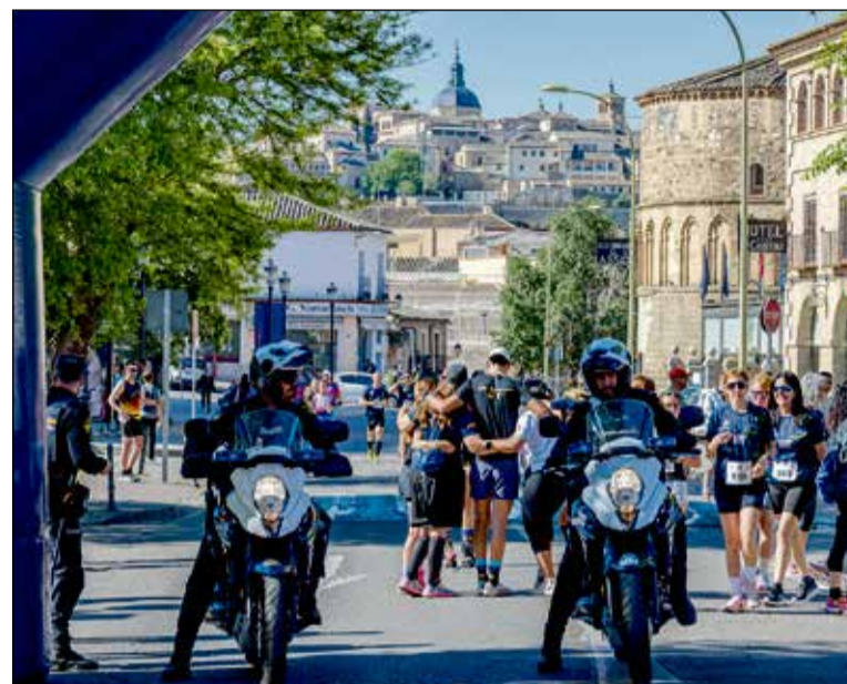
Organizada por la Policía Nacional, esta edición ha logrado recaudar fondos vitales para que la Asociación de Personas con Autismo de Toledo (APAT) continúe su labor con más de 150 familias.