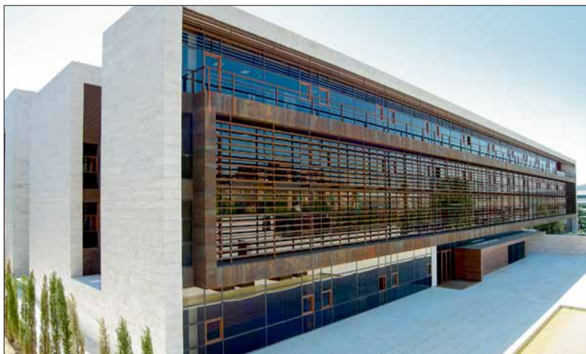
Sanidad aprueba la resolución de 2026 para financiar proyectos y nuevos recursos educativos en materia de consumo. Ayuntamientos y mancomunidades de la provincia podrán solicitar fondos para sus oficinas de información al consumidor.

La resolución establece tres ejes de actuación claramente diferenciados. La primera línea se centra en el mantenimiento y ges-