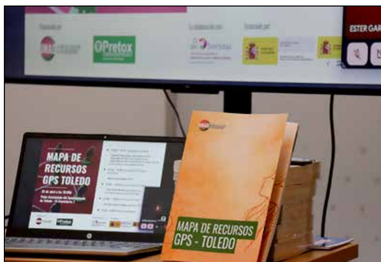
La Sala Capitular del Ayuntamiento acogió los II Premios Huellas de Teresa, consolidando el valor histórico del legado teresiano en Toledo.