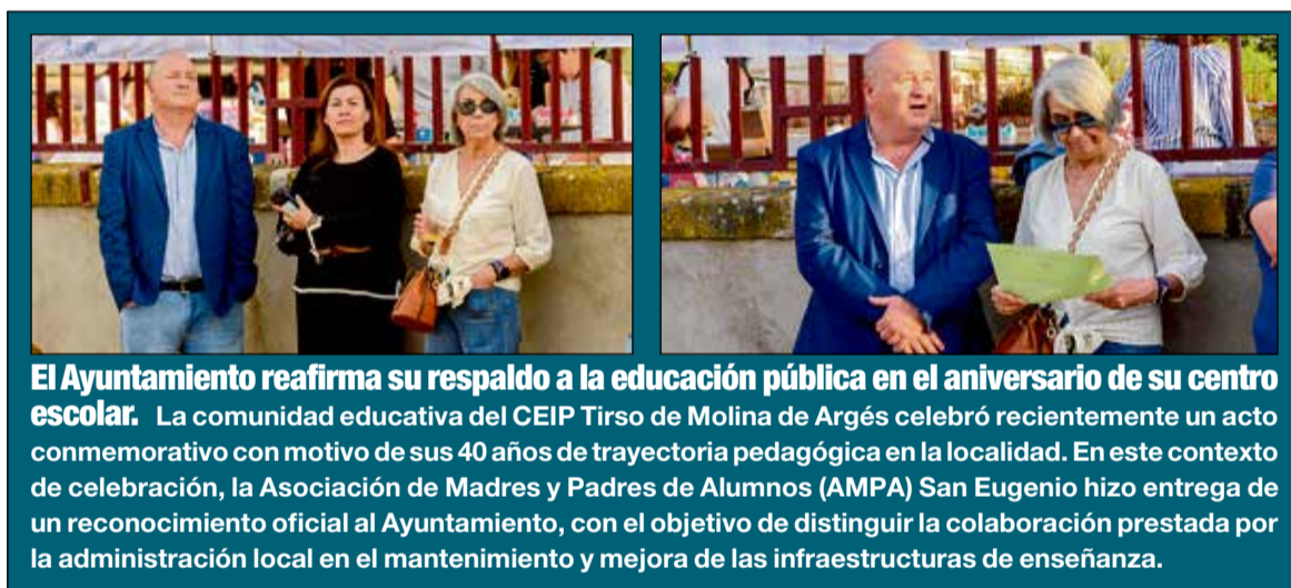
El Ayuntamiento reafirma su respaldo a la educación pública en el aniversario de su centro escolar. La comunidad educativa del CEIP Tirso de Molina de Argés celebró recientemente un acto conmemorativo con motivo de sus 40 años de trayectoria pedagógica en la localidad. En este contexto de celebración, la Asociación de Madres y Padres de Alumnos (AMPA) San Eugenio hizo entrega de un reconocimiento oficial al Ayuntamiento, con el objetivo de distinguir la colaboración prestada por la administración local en el mantenimiento y mejora de las infraestructuras de enseñanza.

La Biblioteca de Argés albergó, el pasado 24 de abril, una iniciativa cultural y pedagógica orientada al público infantil de la localidad. La cita estuvo conducida por la creadora y narradora Brujetea, quien diseñó una propuesta dinámica que fusionó la literatura con el teatro de títeres para ofrecer un espacio de ocio familiar centrado en los valores educativos. La convocatoria estuvo recomendada de manera específica para menores a partir de los 3 años de edad. Según explicaron los organizadores, el propósito fundamental de esta intervención fue incentivar la creatividad, la expresión libre y el interés temprano por la lectura entre los escolares del municipio.