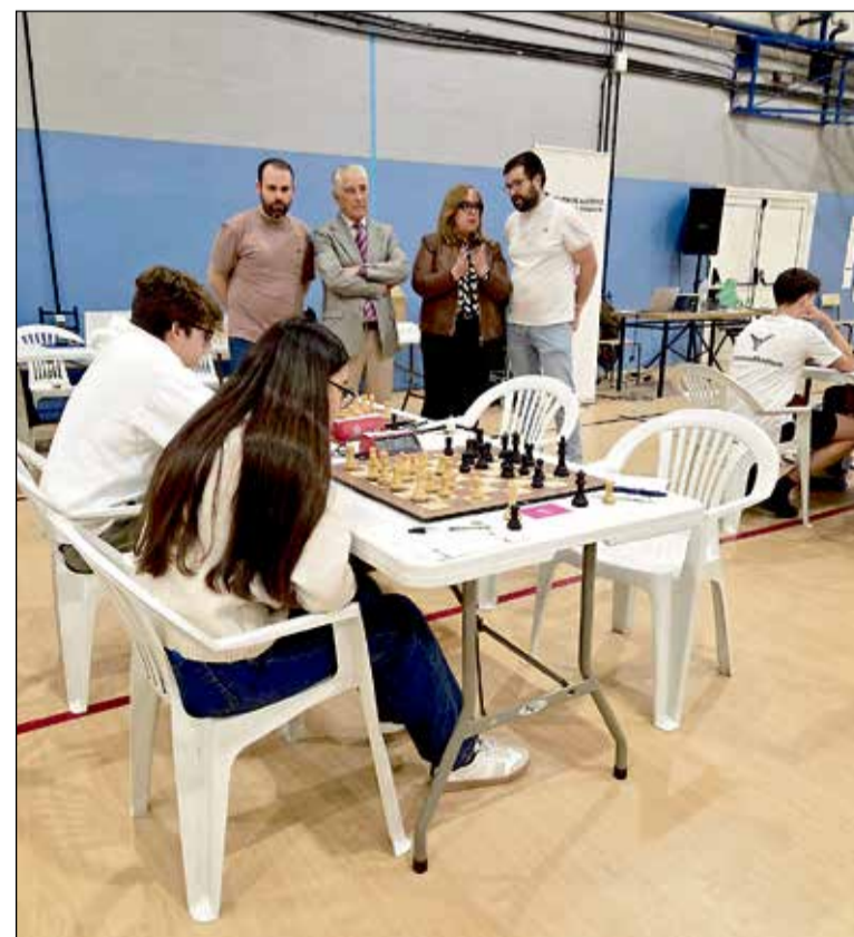
La viceconsejera Carmen Teresa Olmedo anunció cambios para los deportistas de alto rendimiento durante el torneo de ajedrez en Almagro.

El anuncio se produjo en el marco de las competiciones de ajedrez en categorías infantil y cadete, una cita que reunió a destacados jóvenes talentos masculinos y femeninos. La viceconsejera aprovechó el evento para destacar el éxito del programa 'Somos Deporte 3-18', el cual ha experimentado un crecimiento superior al 45 % desde 2015. Este marco normativo que regula a los deportistas de alto rendimiento es una pieza clave para asegurar que el crecimiento en la participación vaya acompañado de un respaldo institucional sólido a todos los niveles del deporte federado. Esta modificación normativa refuerza el compromiso de la Junta con el progreso deportivo, garantizando que el reconocimiento al mérito no se limite únicamente a la competición activa.