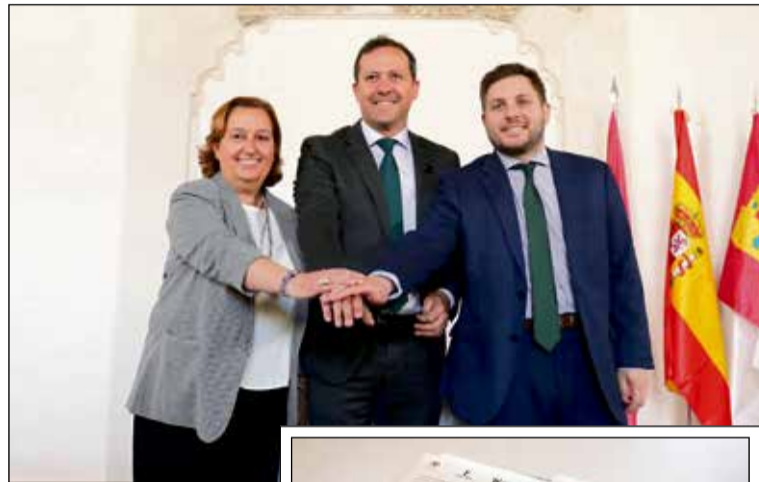
El acuerdo marco establece una vigencia inicial de tres años, con la opción de prorrogarse hasta cuatro años más.

El convenio establece una vigencia inicial de tres años, con la opción de prorrogarse hasta cuatro años más por acuerdo unánime. Los trabajos prioritarios en la estación de autobuses de Toledo se centrarán en subsanar los problemas crónicos de movilidad vertical mediante la reparación definitiva de las escaleras mecánicas y el ascensor. Asimismo, el plan de actuación contempla renovar los sistemas de climatización, instalar bombas de achique contra filtraciones de aguas pluviales y acometer me-