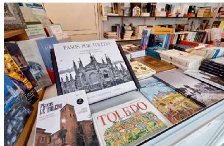
El Ayuntamiento mantiene su hoja de ruta de diversificación urbana, garantizando una sede idónea y renovada para la celebración de la Feria del Libro de Toledo.

El Consistorio mantendrá el Miradero como espacio preferente para futuros eventos una vez se completen las mejoras pendientes en sus accesos, donde el último tramo de las escaleras mecánicas permanece inactivo.