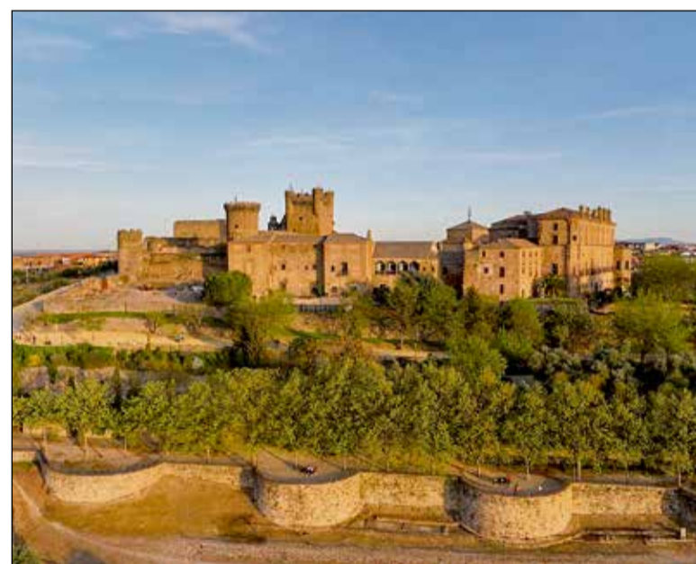
La actuación se enmarca en el Plan de Sostenibilidad Turística en La Campana de Oropesa

El certamen se erige como una plataforma donde se garantiza el relevo generacional en la tauromaquia y posiciona a Toledo como un centro de referencia para la formación de futuros profesionales.