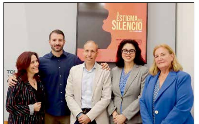
Un documental, con testimonios de expertos, supervivientes y familiares, que tiene el objetivo de dar visibilidad a las impactantes cifras del suicidio en nuestro país y prevenirlo

Para el Gobierno provincial, facilitar el acceso gratuito a estos contenidos es fundamental para que la prevención del suicidio llegue a los colectivos más vulnerables, especialmente jóvenes y mayores. La obra también aborda problemáticas transversales como el acoso escolar y el impacto de las redes sociales en la estabilidad emocional.