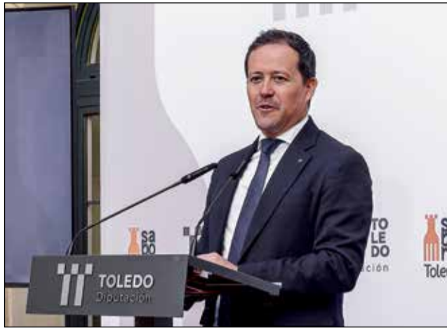
El alcalde de la ciudad Carlos Velázquez.