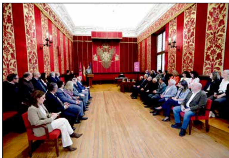
La Sala Capitular del Ayuntamiento acogió los II Premios Huellas de Teresa, consolidando el valor histórico del legado teresiano en Toledo.

De forma complementaria, el programa Senderos en Igualdad organizará cinco rutas guiadas de unas tres horas de duración a lo largo del año, estructuradas en tres itinerarios de primavera y dos de otoño. Los recorridos se desarrollarán por espacios del entorno natural del río Tajo, la Senda Ecológica, la Fuente del Moro y la zona de los Cigarrales.