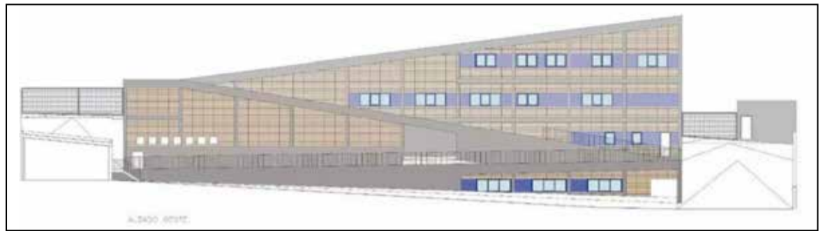
Plano del cuartel de la Policía Local de Toledo.

La planificación económica del Consistorio contempla el uso de estos fondos en cuatro proyectos sectoriales prioritarios. La partida principal financiará la construcción del nuevo cuartel de la Policía Local, una infraestructura cuyo proyecto de ejecución ya se encuentra redactado. Según la de-