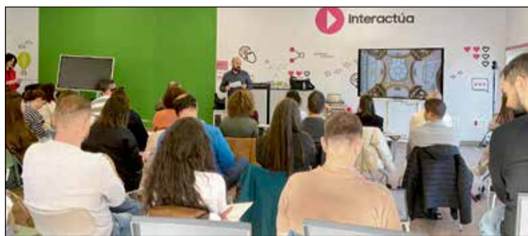
Alumnos y docentes trabajando en un espacio tecnológico del proyecto Aulas del Futuro en Castilla-La Mancha.

La implementación de este modelo de acompañamiento permite que los centros con trayectorias más consolidadas guíen a otros