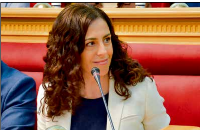
El grupo socialista urge la convocatoria de la Comisión de Movilidad tras un nuevo accidente en Santa Bárbara

El objetivo de la convocatoria de la comisión sectorial es abrir un espacio de debate donde se presenten informes técnicos actualizados y se dé voz a las propuestas de los distintos grupos de la corporación local. El principal grupo de la oposición concluye que la seguridad peatonal en los accesos a los barrios debe abordarse con celeridad.