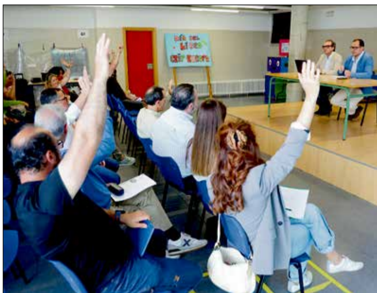
Reunión extraordinaria del Consejo Escolar Municipal para decidir los festivos del calendario escolar en Toledo.

Por su parte, el barrio de Santa Bárbara recibirá una inyección económica de 235.309,88 euros orientada a la reforma del pavimento de la calle Ferrocarril y sus zonas aledañas. Según los informes municipales, esta actuación técnica se complementa con la ya aprobada recientemente en las calles Jarama y Ventalomar del polígono industrial, presupuestada en 307.136 euros. La suma de estos importes consolida la estrategia local de renovación de los viales periféricos que registran una mayor densidad de tráfico rodado.