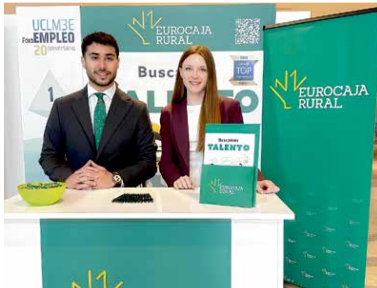
Stand de Eurocaja Rural asesorando a estudiantes sobre empleabilidad y el emprendimiento en el Foro de Empleo UCLM3E.

Durante la jornada, el equipo de Eurocaja Rural mantuvo encuentros personales con estudiantes y recién licenciados, orientándoles sobre los perfiles más demandados y los itinerarios formativos dentro de la organización. El objetivo de estas acciones es reforzar la empleabilidad y el emprendimiento, mostrando un modelo de