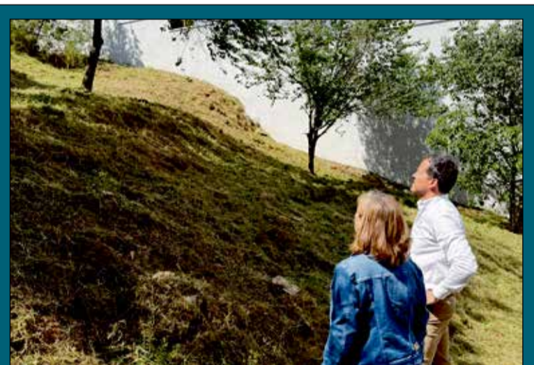
El Ayuntamiento intensifica el desbroce en Toledo para prevenir incendios. Los trabajos prioritarios se concentran en las parcelas municipales cercanas a las zonas residenciales para garantizar la seguridad ciudadana. El objetivo prioritario de estas intervenciones es rebajar la carga de combustible vegetal en el perímetro urbano para minimizar riesgos y proteger el entorno residencial.