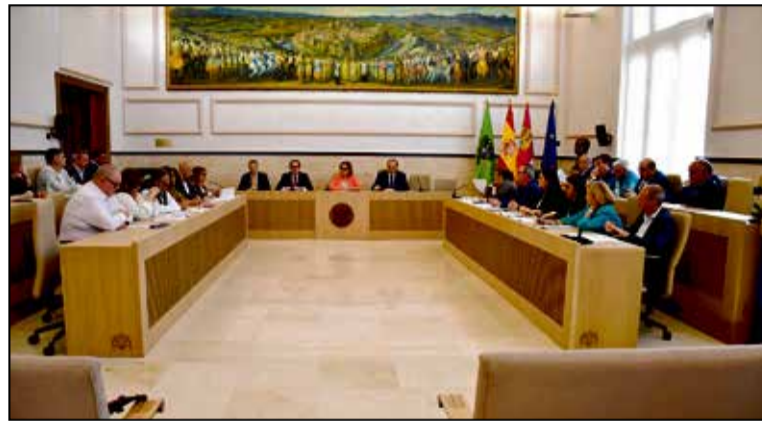
Pleno de la Diputación de Toledo.

La actuación más destacada es la inversión de más de dos millones de euros destinada a la adquisición del edificio de la antigua Escuela de Enfermería de Toledo. Esta operación supone el primer paso para la puesta en marcha de una nueva residencia universitaria que busca ampliar las plazas actuales. Con este