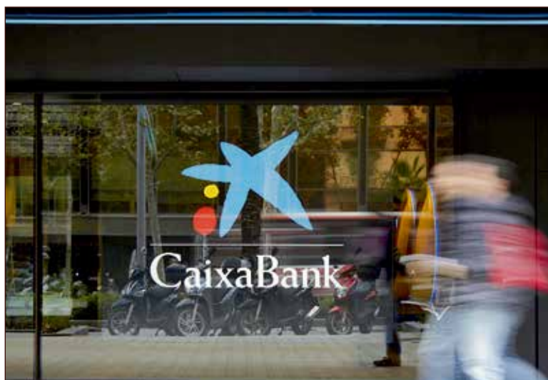
CaixaBank refuerza su apoyo al tejido empresarial regional con nuevos fondos y servicios

Finalmente, con el objetivo de atraer nuevos negocios, se ha puesto en marcha la iniciativa Tax Cashback. Esta promoción, vigente hasta mediados de junio de 2026, permite a los nuevos clientes recuperar hasta 600 euros mediante la domiciliación de impuestos y seguros sociales.