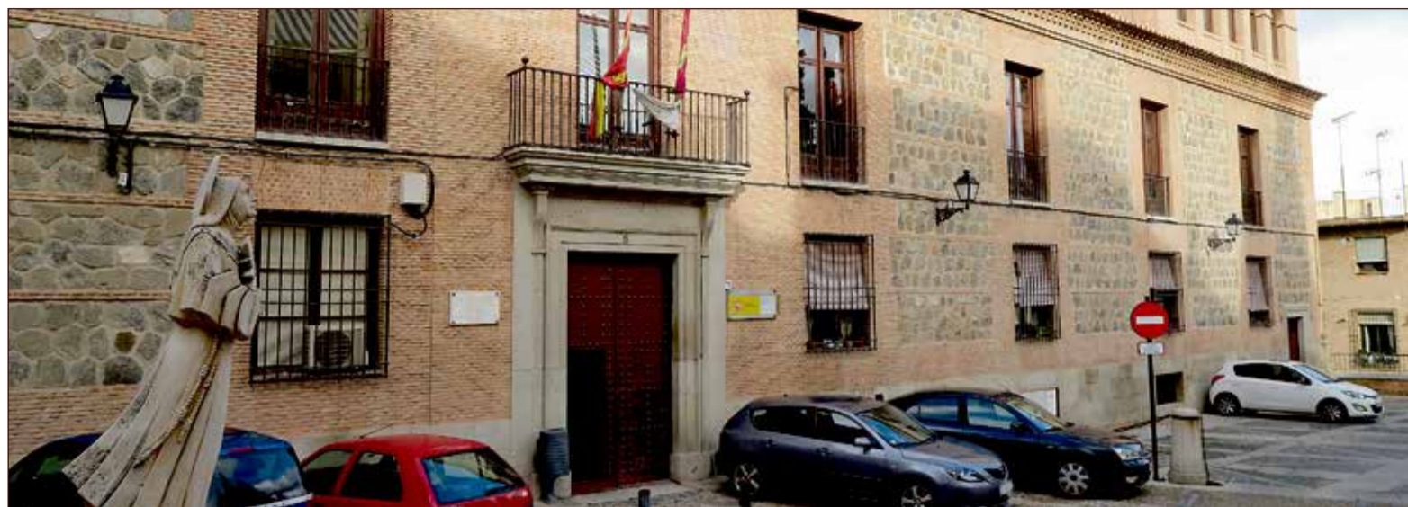
El Palacio del Marqués de Malpica es un edificio ubicado en la plaza de Santa Clara. Diez empresas aspiran a ejecutar la rehabilitación del Palacio de Malpica en Toledo. Las obras, valoradas en 8 millones, finalizarán en 2029.

Uno de los momentos más destacados será la mesa redonda dedicada a la visión de los directivos. En este espacio, varios responsables de firmas de la provincia compartirán experiencias junto a delegados sindicales para exponer casos de éxito.