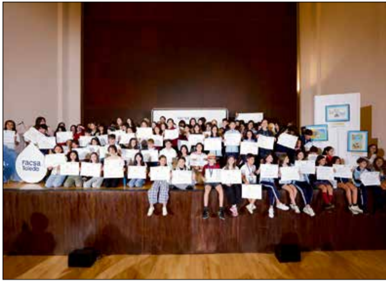
Alumnos premiados en el Centro Cultural San Marcos durante el concurso sobre el cuidado del agua en Toledo.