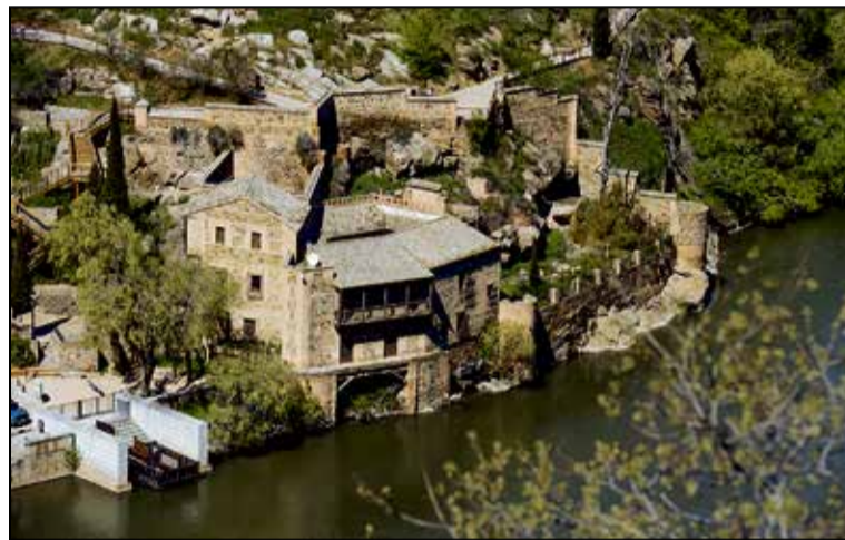
La Casa del Diamantista junto al río Tajo, inmueble por el que el Ayuntamiento de Toledo exige una reforma urgente.