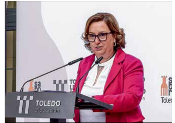
La presidenta de la Diputación, Concepción Cedillo.